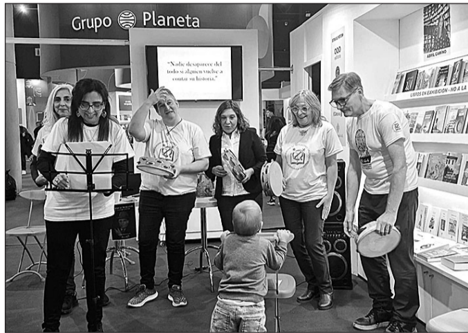
El stand de la Xunta contó con la actuación del 'Grupo do Milenio' de la Federación de Sociedades Gallegas de Argentina.