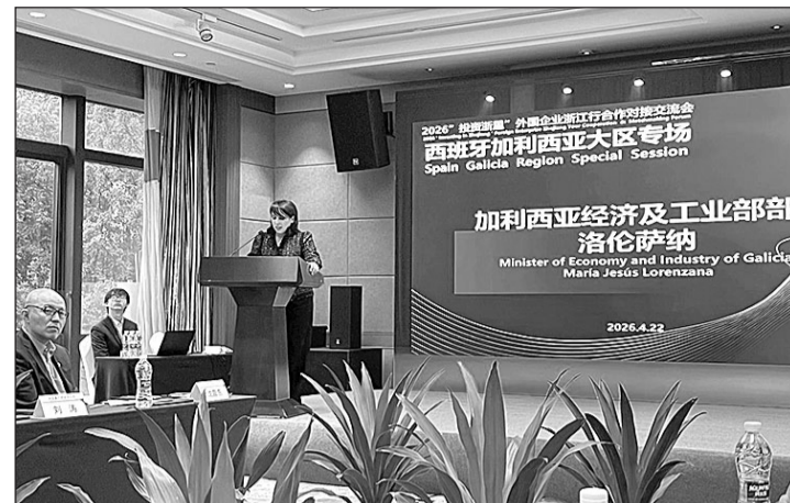
La titular de Economía e Industria, durante su intervención en Hangzhou.

Galicia en un sector en el que la comunidad se sitúa como uno de los principales polos de producción y desarrollo tecnológico en Europa.