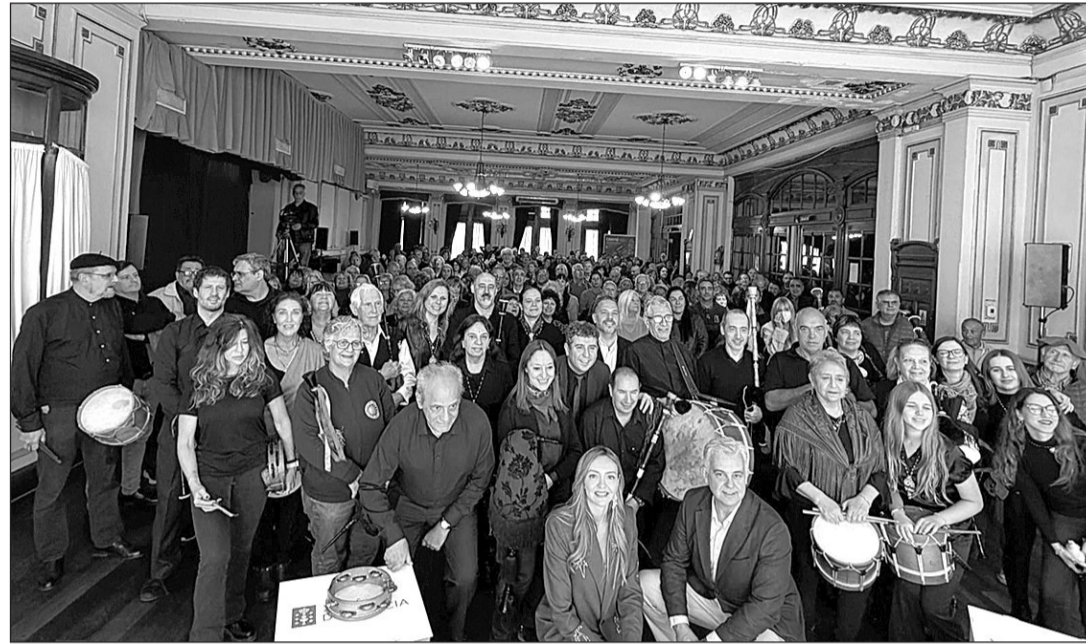
Fabiola García, acompañada por López Dobarro, durante el encuentro en el Club Español con la colectividad gallega.

conselleira defendió el posicionamiento de Galicia como referente internacional en bienestar social. Reivindicó que “Galicia es el mejor lugar del mundo para vivir”, una afirmación que, según explicó, se sustenta en políticas “estables, serias y rigurosas” impulsadas por el Ejecutivo autonómico.