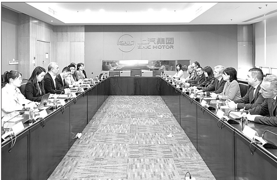
El presidente de la Xunta y la conselleira se reunieron con la directiva de SAIC Motors.