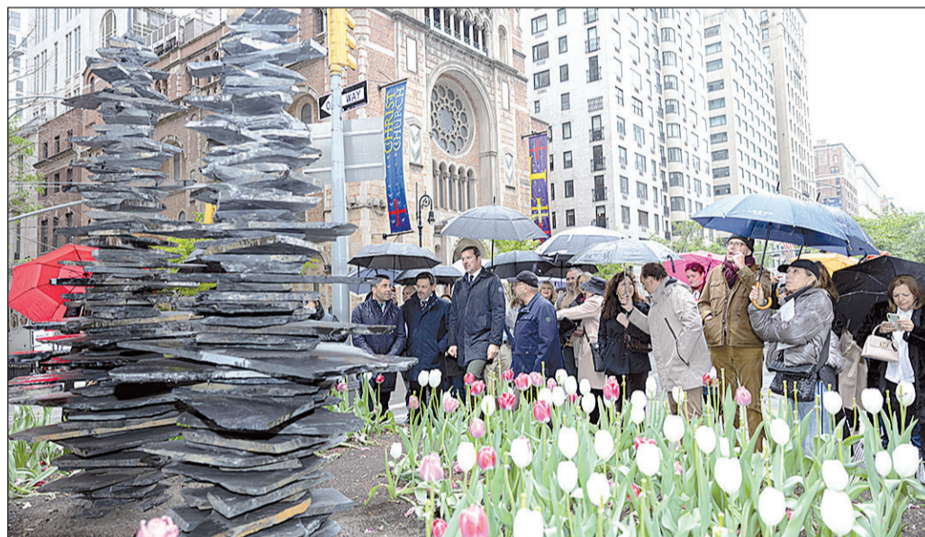
El conselleiro de Cultura y el resto de autoridades observan una de las esculturas de la muestra.

18 Téllez visita Venezuela para conocer la situación actual de los canarios en este país