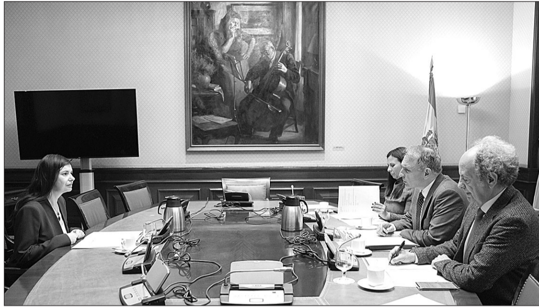
Violeta Alonso, durante su intervención ante los miembros de la Mesa de la Comisión de Exteriores del Congreso.

Respecto a la nacionalidad, se trató tanto lo relativo a la situación actual derivada de la aplicación de la Ley de Memoria Democrática como a la necesidad de avanzar hacia reformas del Código Civil que ofrezcan una