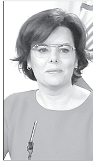
Soraya Sáenz de Santamaría.

que trata de aclarar el presunto operativo parapolicial comandado por el exministro del Interior Jorge Fernández Díaz -imputado en el caso-, para espiar al extesorero Bárcenas y robar documentación comprometedor para el PP en manos del extesorero. Los tres -que comparecieron como testigos- negaron tener conocimiento de cualquier operación en el seno del PP para tratar de destruir pruebas que comprometieran la contabilidad del partido.