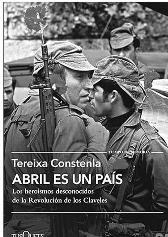
El libro de Constenla sobre la Revolución de los Claveles.