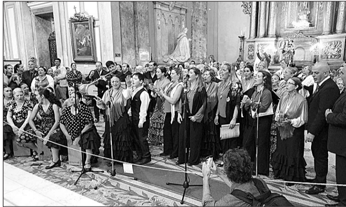
Actuación de algunos de los coros en la Catedral Metropolitana.

versatorio 'El Rocío sin fronteras: fe, tradición y patrimonio universal', con tamborileros, coros rocieros, entre ellos, el coro 'Luna y Candela' del Centro Andalucía de Buenos Aires y hermandades de siete países.