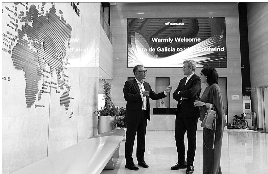
El presidente Rueda y la conselleira Lorenzana conversan con un representante de Goldwin.

Con vistas a una posible sinergia, el presidente explicó el Plan de repotenciación de la Xunta, que prevé actuar en los