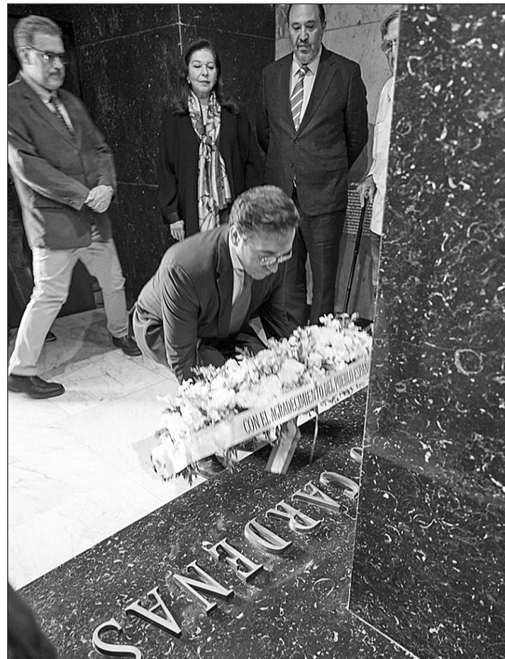
José Manuel Albares deposita la ofrenda floral en el monumento que recuerda a Lázaro Cárdenas en la capital mexicana.

El ministro ha remarcado los esfuerzos realizados para dar respuesta a las más de 2,45 millones