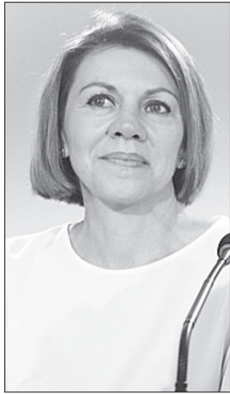
Dolores de Cospedal.