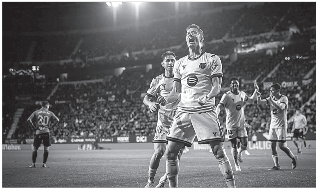
Lewandowski celebra su gol, que abría el camino del triunfo del Barcelona en Pamplona.

El conjunto catalán salió mandón, con dos ocasiones de Lewandowski y Dani Olmo, ante un Osasuna que buscó priorizar sus labores defensivas para después salir hacia la meta rival con las