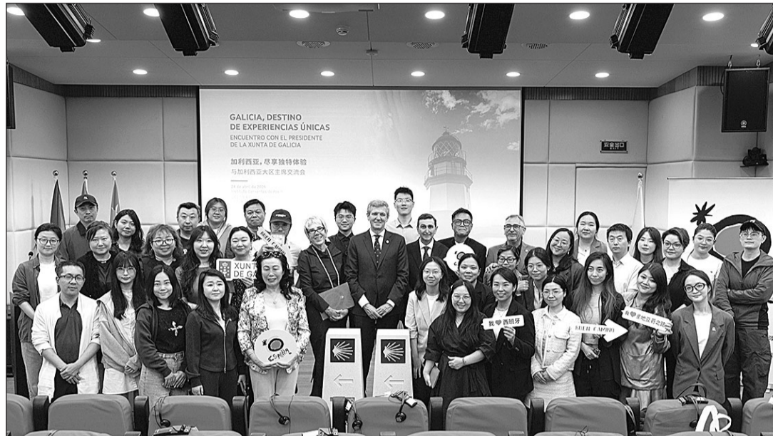
El presidente Rueda, con los operadores turísticos participantes en la presentación.

En su intervención ante los operadores, el presidente autonómico