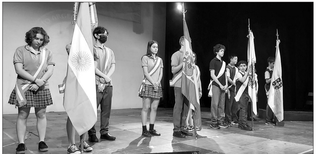
Los alumnos del Instituto portan distintas banderas al inicio del acto.

Bailes tradicionales, coro escolar y una conferencia sobre la personalidad de Fernández del Riego, de