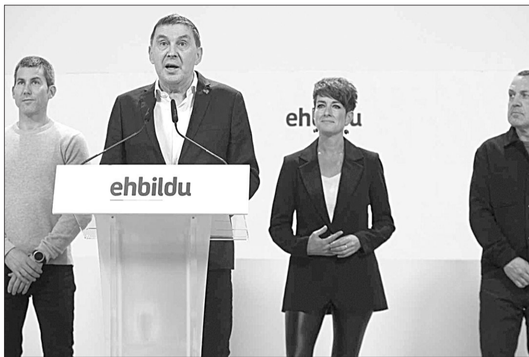
El coordinador de EH Bildu, Arnaldo Otegi, aplaudió ante la prensa la decisión de los 7 candidatos.

Explican que no pueden renunciar oficialmente a las listas electorales porque están ya cerradas y oficializadas y “solo se