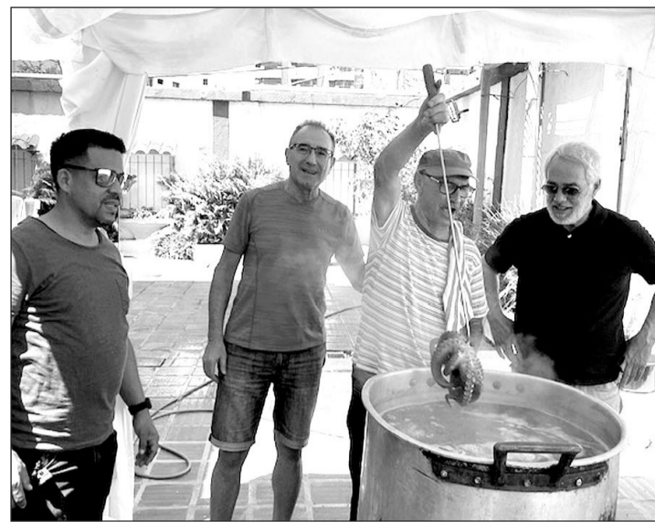
Directivos del Centro cocinando el pulpo.

El secretario xeral de Emigración les trasladó el apoyo de la Administración autonómica, comprometiéndose a ayudarles en el impulso de sus actividades, trasladadas ya a segundas y terceras generaciones nacidas en el país de acogida.