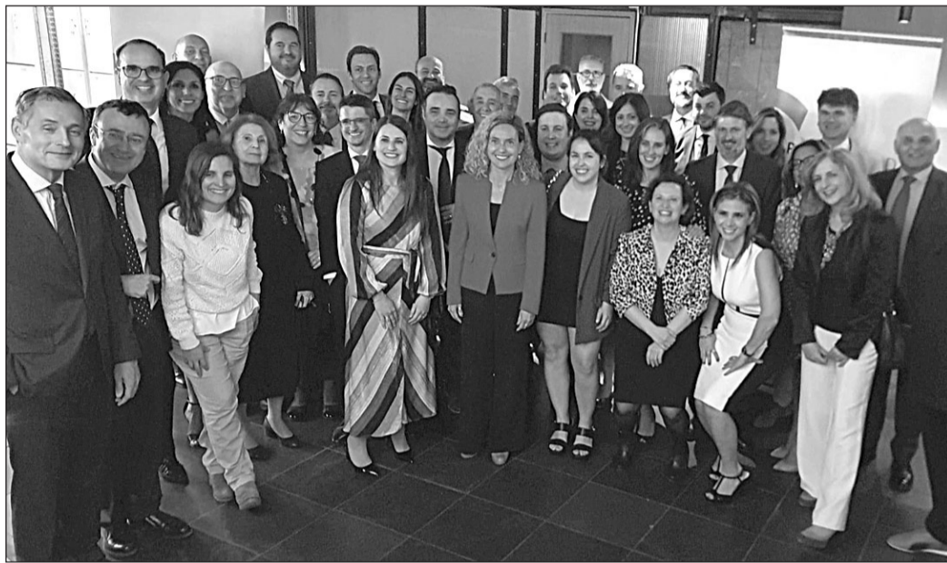
Meritxell Batet, durante su encuentro con la colectividad española en Canadá.

Finalmente, inauguró la exposición de Pablo Picasso ‘La Celestina’, en los Archivos Nacionales de Canadá. Batet afirmó que “si por algo es y debe ser reconocida España es por su cultura y por sus artistas, un activo de valor incalculable que engrandece nuestra presencia en todo el mundo. Gracias a la Embajada de España, al emba-