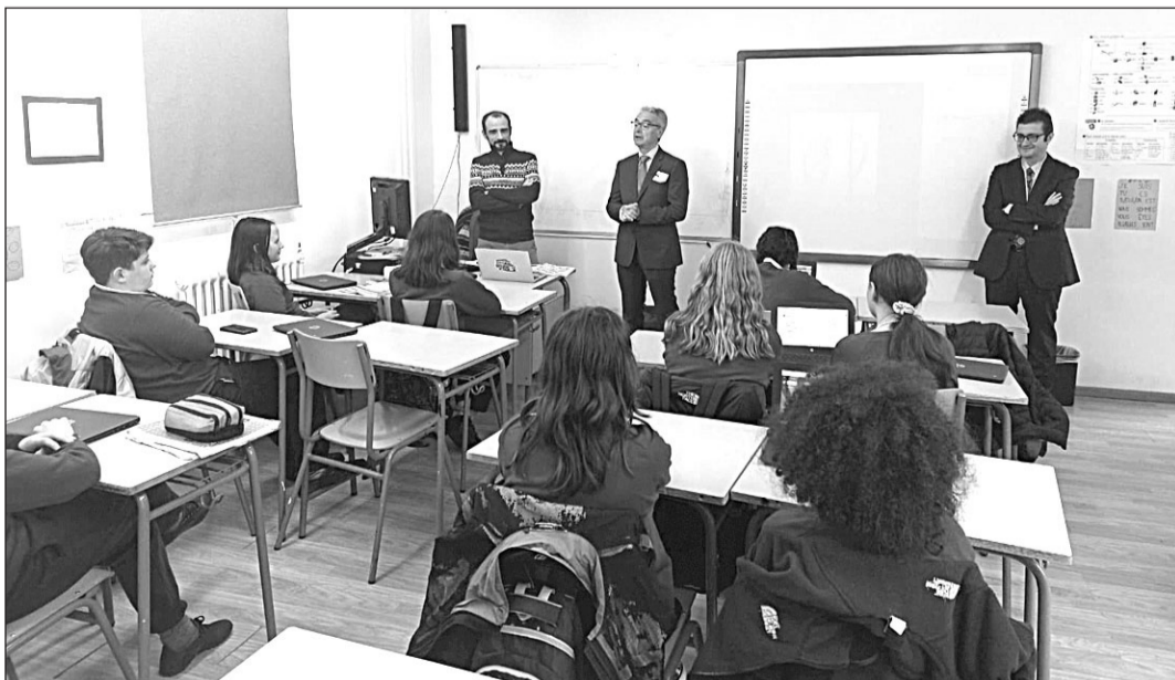
El embajador conversa en una aula con algunos alumnos durante su visita al Instituto.

“La escuela es un notable ejemplo de excelente educación, enriquecida por estudiantes españoles y británicos”