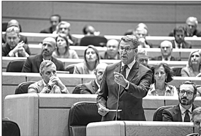
Feijóo, durante el debate en el Senado del pasado miércoles.

Feijóo cargó contra Sánchez por reaccionar primero con "mutismo" a las informaciones que desvelaban la incursión de condenados por terrorismo en las listas de EH Bildu para, seguidamente, terminar criticando al PP, por lo que le espetó: "Ha sido más cruel con el PP que con Bildu y más generoso con los verdugos que con las víctimas". "Si del 'Sanchismo' hubiese dependido habría asesinatos en las insti-