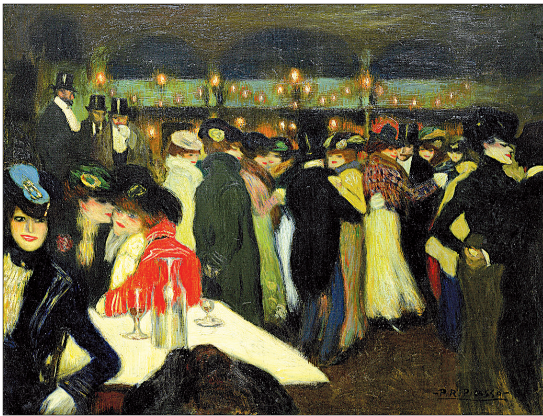
El cuadro 'Le Moulin de la Galette' es una de las obras que conforman la muestra 'El joven Picasso en París'.

La muestra se enmarca en el programa de la Celebración Picasso 1973-2023, con más de cincuenta exposiciones y eventos para conmemorar el 50º aniversario de su fallecimiento, entre las que destacan las siete programadas para Estados Unidos, algunas de las cuales cobraron protagonismo meses atrás.