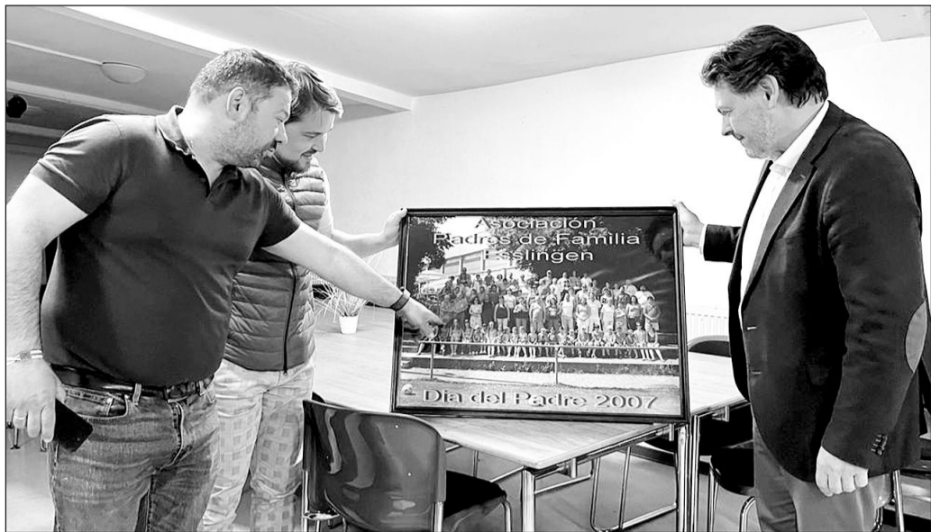
Los responsables de la Asociación le muestran una fotografía histórica de la entidad a Miranda.