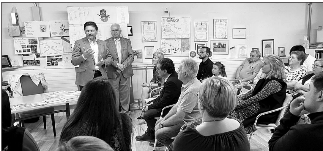
El secretario xeral de Emigración, durante su intervención en el acto en Zúrich.

Finalmente, tuvo lugar también la publicación de una banda diseñada titulada ‘Un día para as letras’ destinada a los más pequeños para que pudieran conocer la vida y obra del ensayista, narrador y editor gallego a quien se homenajeaba en esta ocasión, y que se pudo ver y leer, de manera gratuita, en la página web de la Secretaría Xeral de Emigración.