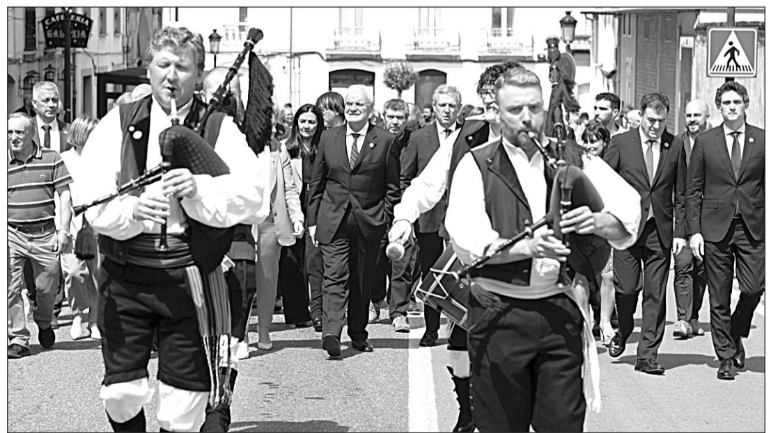
Alfonso Rueda, acompañado por otros dirigentes, vivió en Lourenzá los actos en homenaje a Del Riego.

“En este 17 de mayo podemos afirmar con orgullo –prosiguió Rueda– que en la Galicia actual la lengua no es un motivo de confrontación ni de reyerta. Quien se empeñe en buscar fron-