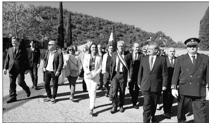
Autoridades españolas y francesas, junto con los otros asistentes, recorren uno de los caminos que los españoles utilizaban para exiliarse en Francia.

Memoria Democrática que entró el vigor el mes de octubre del pasado año y que recoge la celebración del 8 de mayo como “día de recuerdo y homenaje a los hombres y mujeres que sufrieron el exilio” como consecuencia de la Guerra Civil y la dictadura franquista. Además, considera a los cerca de medio millón de españoles exiliados, algunos de los cuales sufrieron la deportación y exterminio en campos de concentración nazis, entre las víctimas de la Guerra Civil y la dictadura, con derecho por lo tanto al “reconocimiento y reparación integral” por parte del Estado.