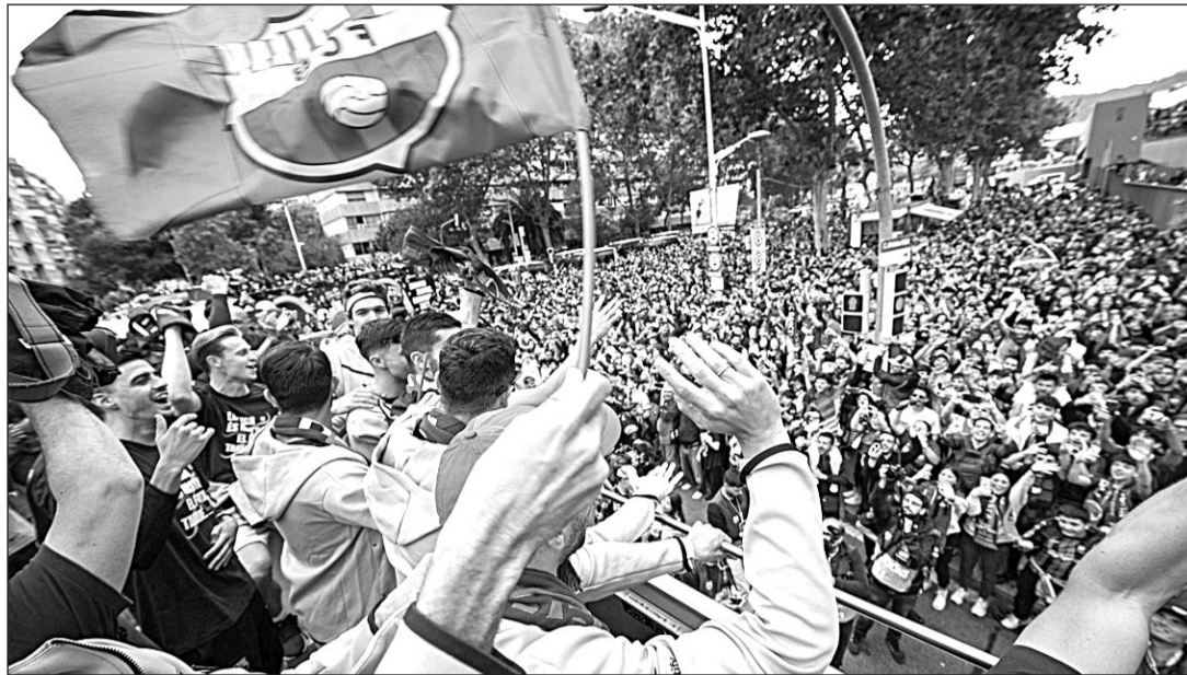
Los jugadores del Barcelona, en un autobús, recorrieron las calles de la ciudad el pasado lunes para celebrar el título.

El gol de Julián Álvarez en el último suspiro fue la puntilla a un Real Madrid que pocas veces, por no decir ninguna, estuvo tan superado en Europa. Ahora queda por ver si una plantilla que lo ha ganado todo y que en muchas posiciones está envejecida es capaz de levantarse de esta.