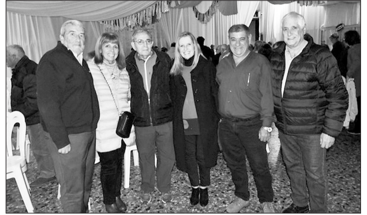
La delegada de la Xunta flanqueada por el presidente y expresidente de la entidad, junto a otros asistentes.