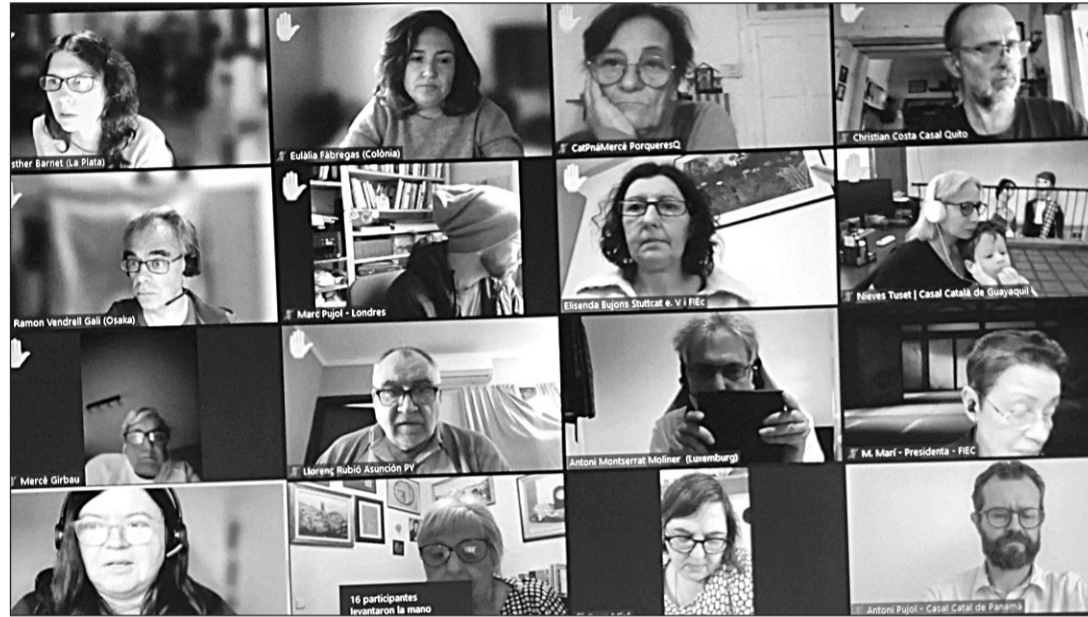
Merixell Batet, durante su encuentro con la colectividad española en Canadá.

Se destinó una atención particular a analizar las actividades de la FIEC en relación a la puesta en marcha de la reforma de la ley electoral y a la abolición del 'voto rogado'. Se expusieron en detalle las instrucciones de la JEC (Junta Electoral Central) pa-