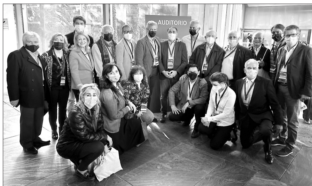
Dirigentes del PP gallego posan con compromisarios del exterior durante el encuentro celebrado en Sevilla.

dijo sentirse “honrado, y a la vez, emocionado” de poder compartir su experiencia en el exterior en este Congreso, ya que el hecho de crecer en Latinoamérica, “en ambientes de crisis, inflación y volatilidad”, le ha permitido “desarrollar resiliencia y empatía ante la grave situación que vive actualmente Europa, España y el mundo entero”.