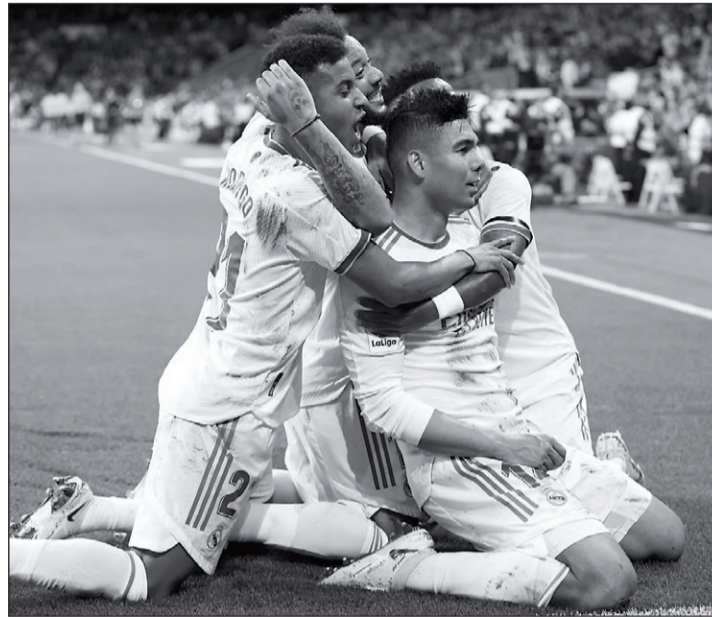
Los jugadores del Real Madrid abrazan a Casemiro tras su gol.

Carlo Ancelotti no quería un exceso de confianza y el equipo lo demostró desde los primeros instantes. Ya en el minuto 4 Benzema superó a David Soria, pero el colegiado anuló el tanto por fuera de juego. Con el peligro de que se atasara el encuentro parecía llegar el descanso, hasta que el Real Madrid volvió a sacar a relucir su calidad