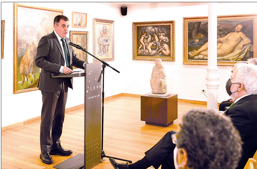
El consejero de Cultura de la Xunta presenta la muestra sobre Laxeiro, rodeado de cuadros del pintor gallego.

cia de numeroso público que, una vez finalizado el acto protocolario, realizó una visita guiada por el comisario de esta retrospectiva, que reúne una treintena de piezas procedentes de colecciones privadas e instituciones como el Museo Municipal Ramón María Aller de Lalín, el Museo de Pontevedra o Fundación para recorrer las dos décadas (1950-1970) en las que el pintor se instaló en Buenos Aires.