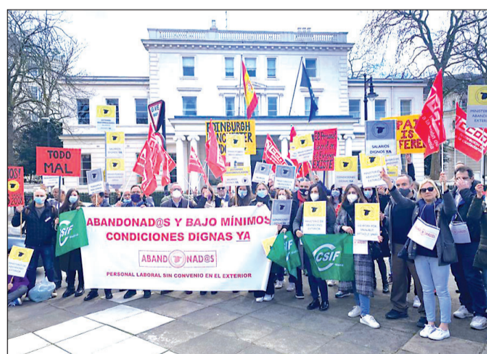
Personal del servicio exterior se manifiesta ante la Embajada en Londres.