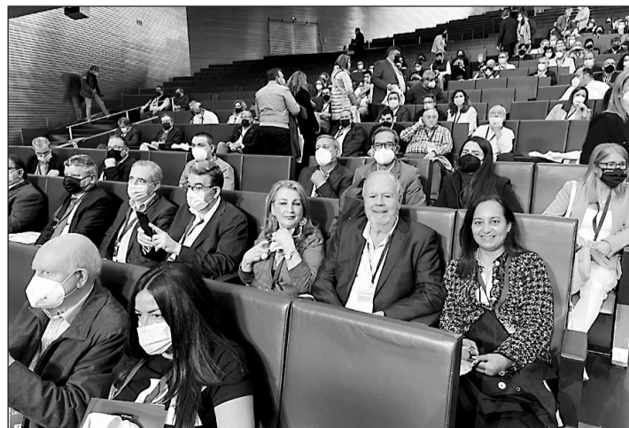
Un grupo de compromisarios procedentes del exterior durante el congreso del PP celebrado en Sevilla.