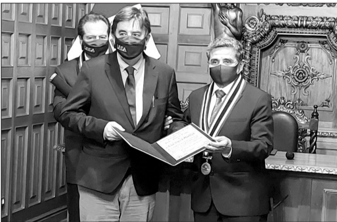
García Montero recibe el 'honoris causa' en la Universidad San Agustín.

El director del Cervantes agradeció el honor académico con un discurso sobre el valor del español como idioma mestizo, el diálogo entre lenguas, la ciencia y la técnica como eje fundamental de la so-