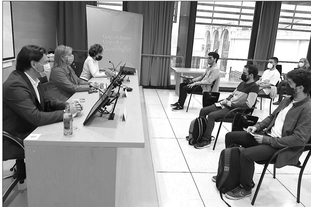
Responsables de Emprego y Emigración, durante la presentación del programa.

La formación se aborda desde dos acciones de sesenta minutos cada una: una 'Master-