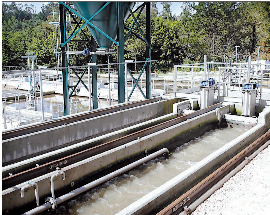
La función de las depuradoras es esencial para evitar vertidos y garantizar la calidad de las aguas.

A día de hoy conviven en Galicia distintos modelos de gestión del agua. Desde la que ejercen los ayuntamientos sobre sus propios sistemas, a las que llevan a cabo los consorcios, mancomunidades y sociedades supramunicipales. También existen depuradoras, que son gestionadas directamente por Augas de Galicia, que ayuda a los ayuntamientos en sus competencias municipales.