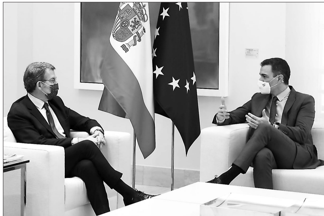
Alberto Núñez Feijóo y Pedro Sánchez, durante su encuentro en La Moncloa.

"La Proposición de Ley Orgánica -explican- fue tomada en consideración con una amplísima mayoría de 343 votos a favor el 23 de febrero de 2021 y lleva más de un año en tramitación parla-