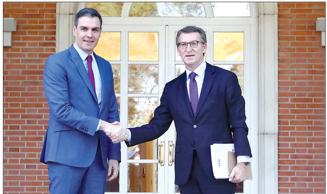
Pedro Sánchez y Alberto Núñez Feijóo se saludan al inicio de su encuentro en La Moncloa.