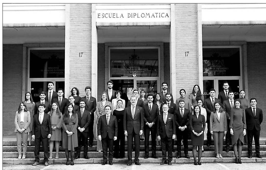
El Rey posa con los jóvenes que recibieron sus despachos.

Son mujeres las tres primeras personas en el escalafón de esta LXXIII Promoción, del cual el 76% procede de universidad pública y el 24% de universidad privada, además de doce comunidades autónomas, con una edad media de 30