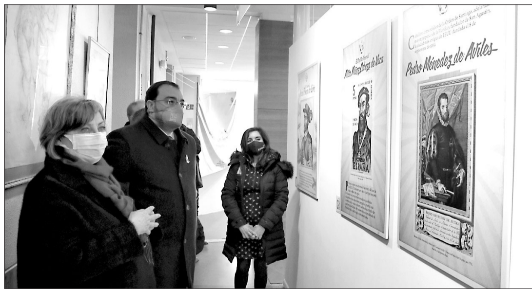
El presidente del Principado, Adrián Barbón, durante la visita a la exposición.

El plazo de solicitud de la subvención, según se recoge en el Boletín Oficial del Principado de Asturias (BOPA) del pasado día 4, será de 20 días hábiles contados a partir del siguiente a la publicación de la resolución en dicho Boletín.