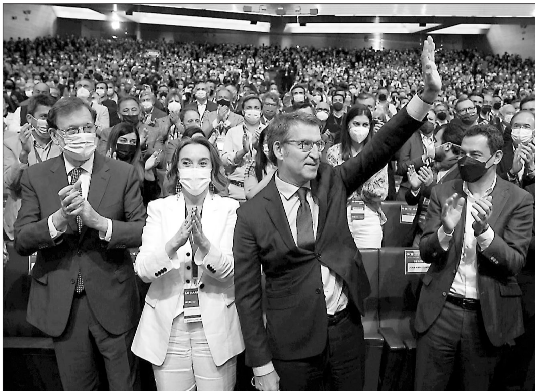
Alberto Núñez Feijóo es aclamado tras convertirse en el nuevo presidente del PP en el congreso de Sevilla.

En este punto, Sánchez mostró su preocupación por que el PP pueda asumir las tesis de Vox, que prefiere hablar de vio-