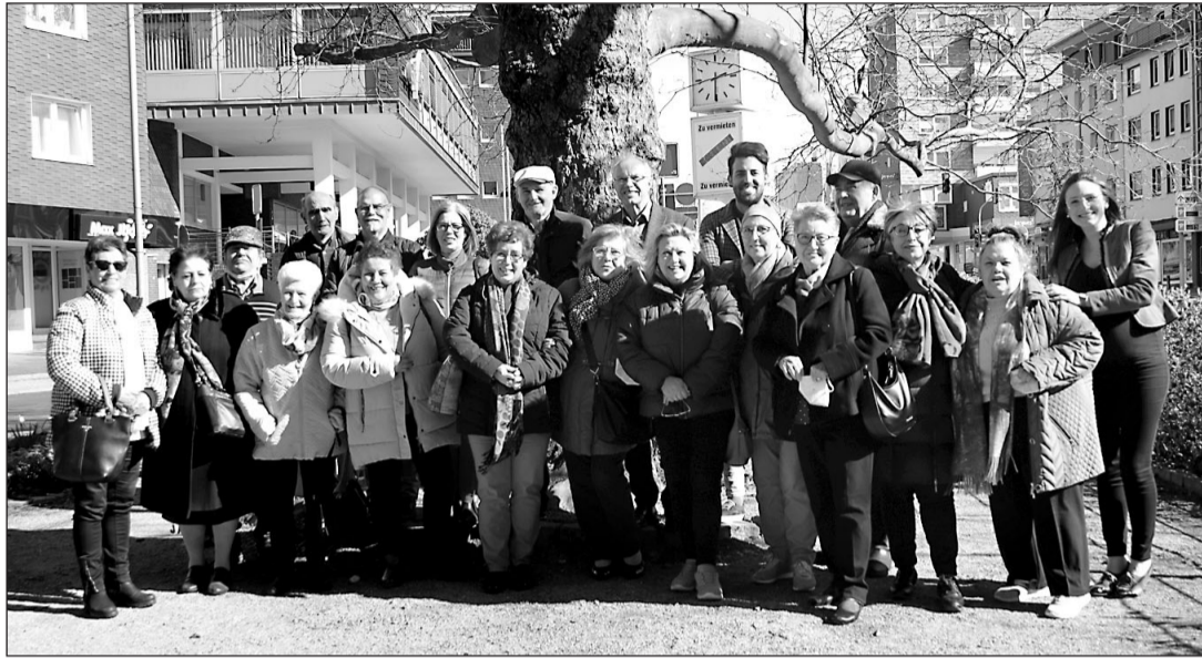
Participantes en el segundo taller de animación sociocultural para personas mayores.

seguir para mejorar la atención personalizada, tanto de personas mayores como de personas con discapacidad.