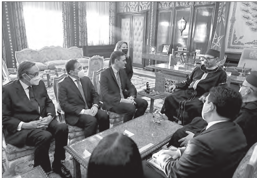
Pedro Sánchez, acompañado por el ministro José Manuel Albares, durante la reunión con Mohamed VI.

Así, Pedro Sánchez y Mohamed VI acordaron el pasado jueves que se abrirán de modo "gradual y ordenado" las fronteras de Marruecos con España, restableciendo las conexiones