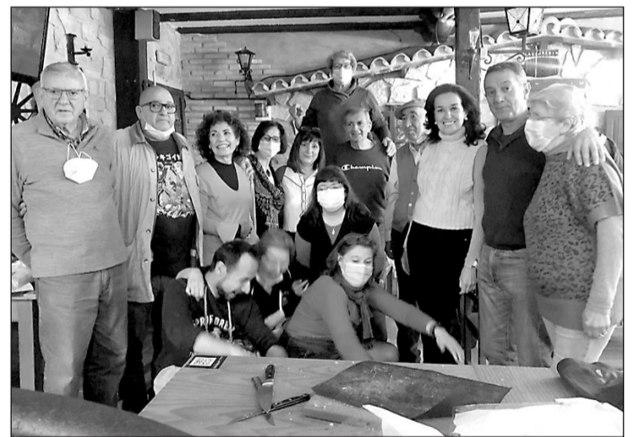
Participantes en el Curso de Cocina Asturiana.

La Asociación ‘The Legacy’ es una iniciativa civil, privada, sin ánimo de lucro, cuyos fines estatutarios son poner en valor la trascendencia de la contribución histórica y cultural de España en relación con los Estados Unidos de América para fomentar y promover los lazos de unión entre ambos países.