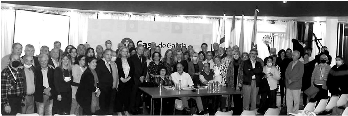
Asistentes a la constitución de la nueva entidad asociativa, el pasado 5 de abril.

Los estatutos de A Casa de Galicia Centro Histórico Cultural fueron aprobados por unanimidad