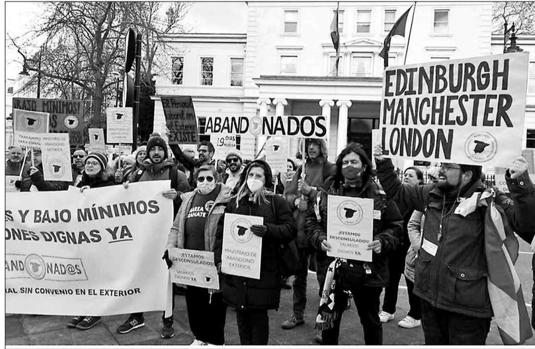
Personal laboral de los consulados y la Embajada en Londres, durante la protesta del pasado 1 de abril.

En este contexto, las diferencias retributivas entre el personal laboral de una misma categoría administrativa representan un agravante adicional, ya que paradójicamente