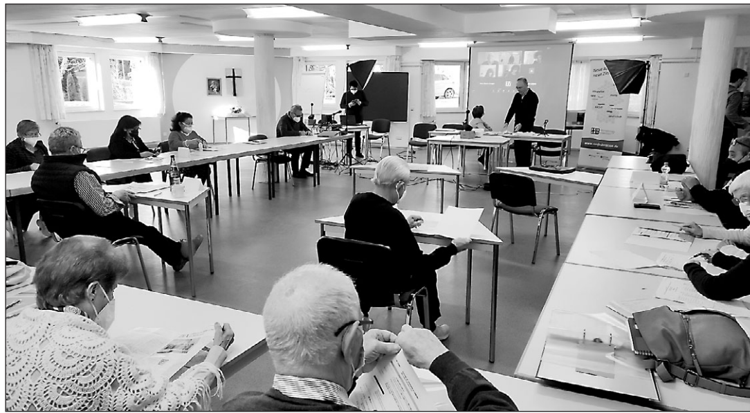
Plenario del primer Seminario 'Adentro' de este año.

contexto, pero que, aun así, "vamos a seguir construyendo el mundo y unas condiciones de vida mejor para las personas mayores".