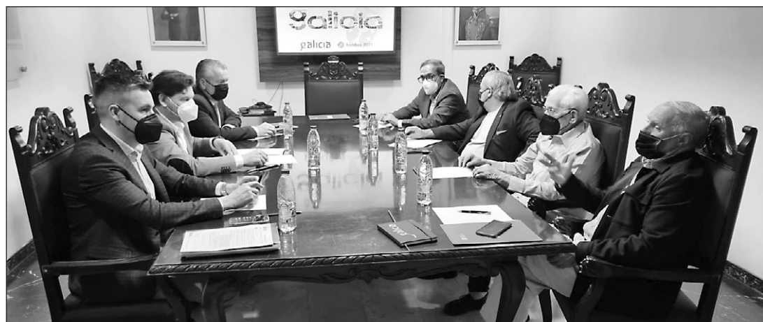
El secretario xeral y los responsables de los centros, durante la reunión celebrada a mediados de marzo en Caracas.

A mayores, durante este encuentro, el secretario xeral también ofreció información sobre otras líneas de ayuda al retorno que programa su departamento, que abrirán en breve su convocatoria. En concreto, se refirió a las ayudas de carácter social al retorno y las ayudas para los emprendedores retornados.