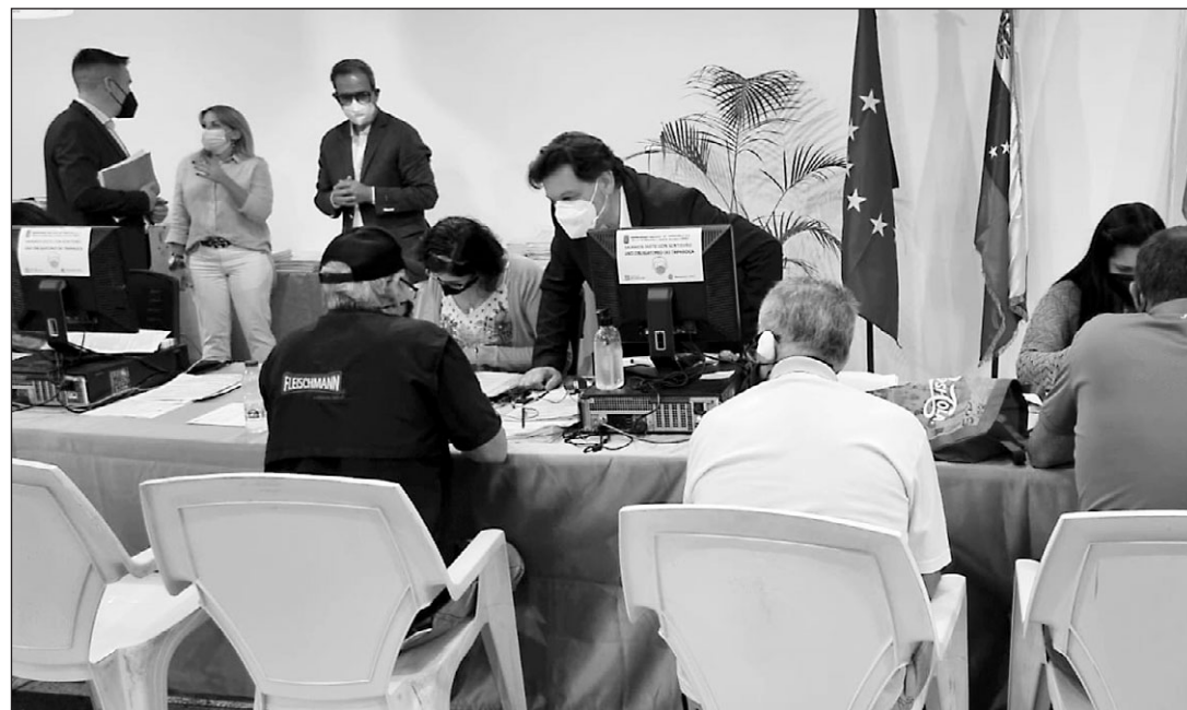
El secretario xeral de Emigración, durante su visita a la Hermandad Gallega de Venezuela.

Durante la visita a la Oficina social de la Hermandad Gallega de Venezuela y su Centro de Día, Miranda agradeció su labor y el apoyo que desde la misma se está ofreciendo a los gallegos de este país que presentan mayores necesidades. En su visita a la principal enti-