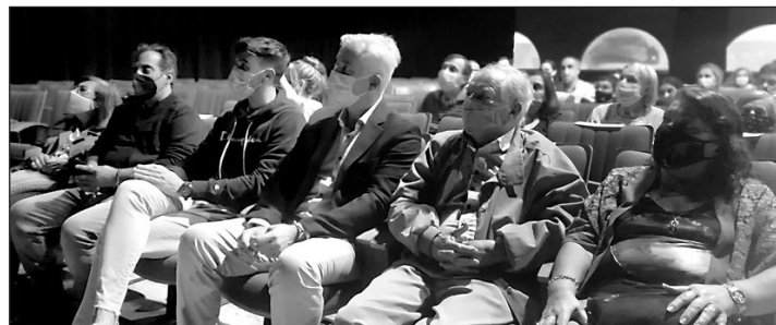
El delegado de la Xunta en Argentina, junto a directivos del Instituto Educativo Santiago Apóstol y del Centro Galicia de Buenos Aires.