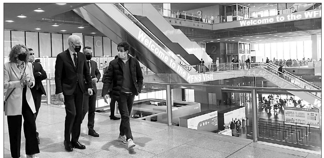
El vicepresidente gallego, durante su visita al Centro Internacional de Convenciones Ágora de Bogotá.

El vicepresidente también destacó que las impresionantes fachadas de Aluman en Colombia —donde cuenta con una filial con una veintena de empleados— se ven en