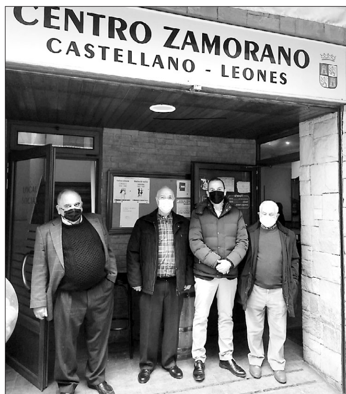
El presidente de la Diputación y directivos de la entidad, delante del Centro Zamorano en Barakaldo.

En ese mismo acto promocional, cuya fecha aún no está determinada, se mostrarán los productos de calidad agrupados bajo la denominación de Alimentos de Zamora.