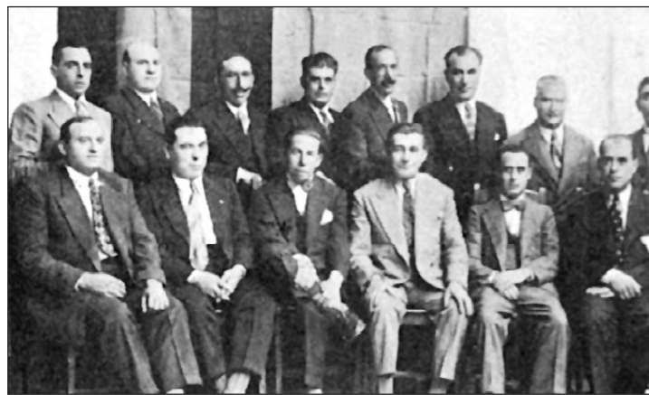
Directiva de la entidad ‘Residentes de Vigo’ durante el año 1933-34.