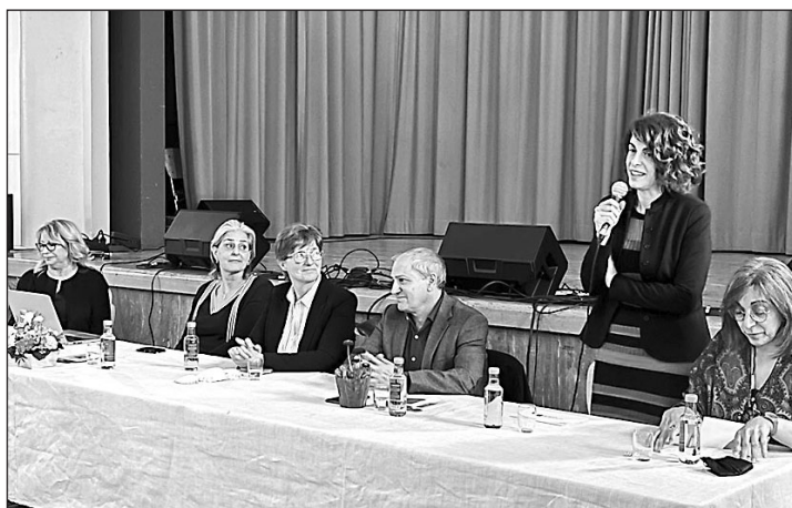
La subdirectora de Comunidades Galegas participó en la clausura.

ción del grupo folclórico de la Irmandade Galega, así como con la representación de las Cantigas de Elena y con dos charlas versadas sobre los Caminos de Santiago y los propios trajes tradicionales. Esta asociación, que cuenta con un total de 318 socios, de los cuales 293 son galle-