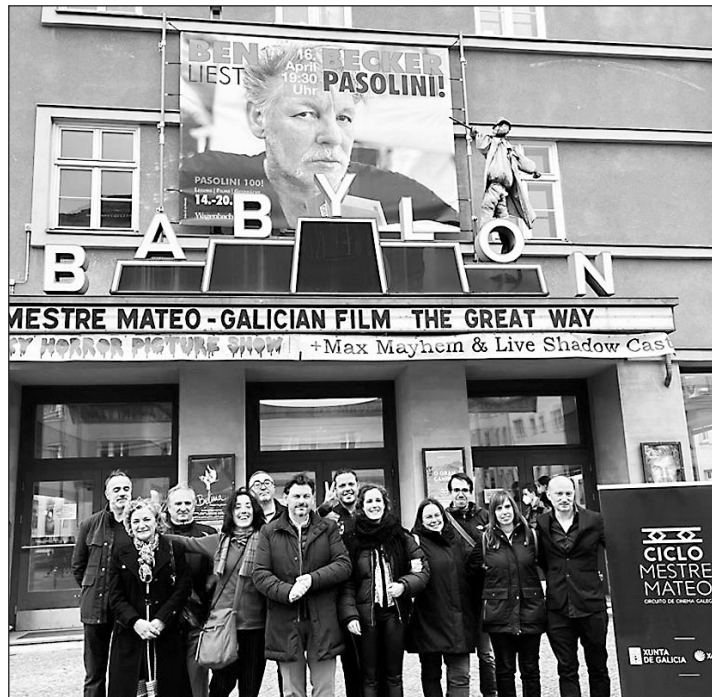
Miranda y directivos de la asociación De Berlín Son, ante el cine Babylon.

de destacar el importante trabajo realizado por estos ocho centros gallegos del exterior que, como aquí, en Alemania, están potenciando nuestra cultura entre el propio colectivo, pero también entre los propios berlineses. Sin su apoyo el éxito de hoy no podría ser una realidad", remató el secretario xeral animando a todos a repetir experiencia el próximo mes de abril con una nueva proyección audiovisual.