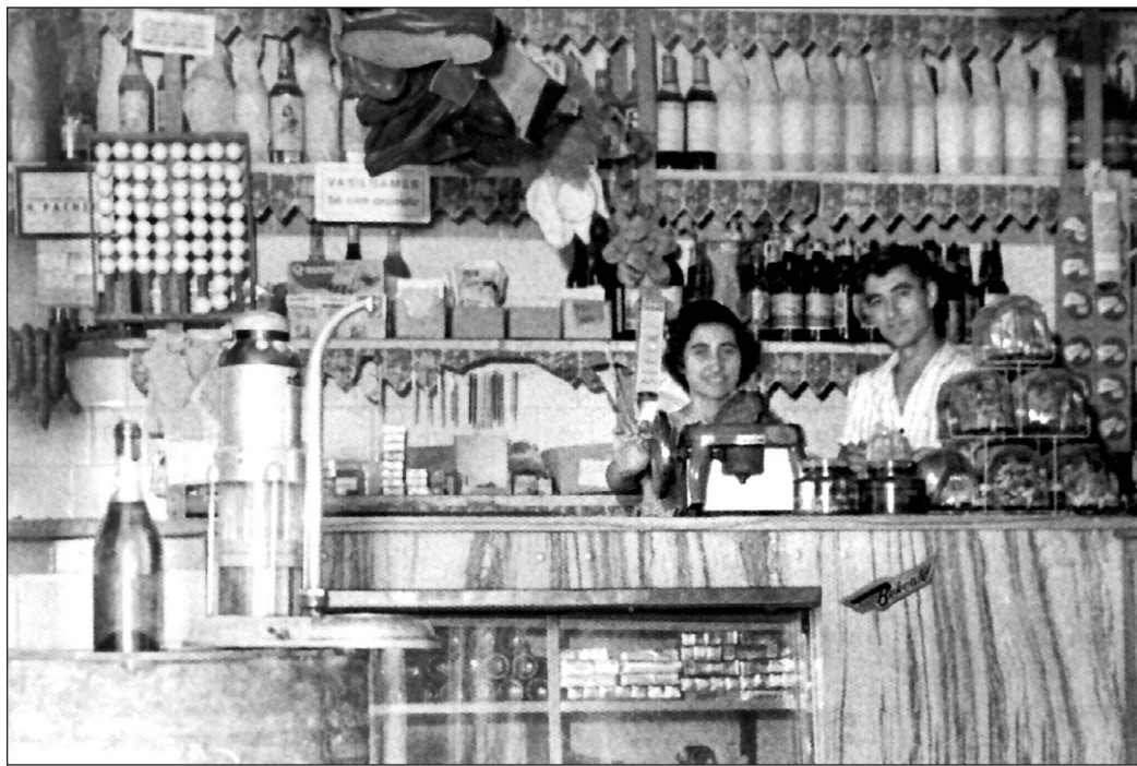
Emigrantes salmantinos en su tienda de ultramarinos en Brasil.

No se pretende que las familias se desprendan de las fotos originales, sino de que las faciliten digitalizadas o bien se las cedan temporalmente a alguno de los colaboradores en el proyecto, para que sean ellos los que las digitalicen y las envíen a una dirección electrónica, devolviendo los originales a sus