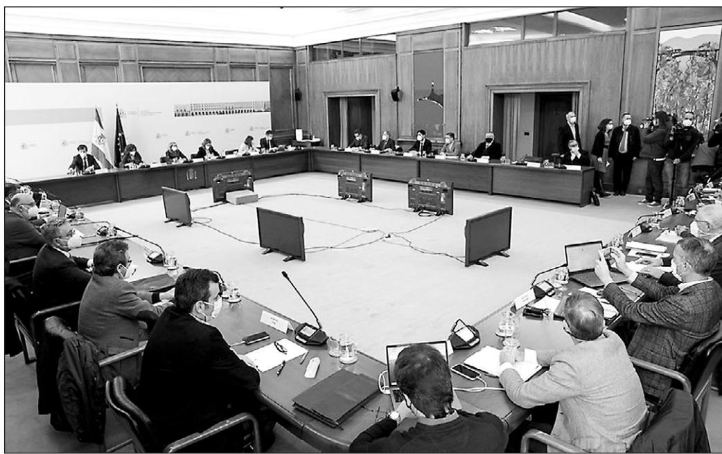
El Gobierno se reunió el pasado jueves con los representantes de los Departamentos de Mercancías y Viajeros del Comité Nacional de Transporte por Carretera.

El acuerdo incluye una rebaja de 20 céntimos por litro en el