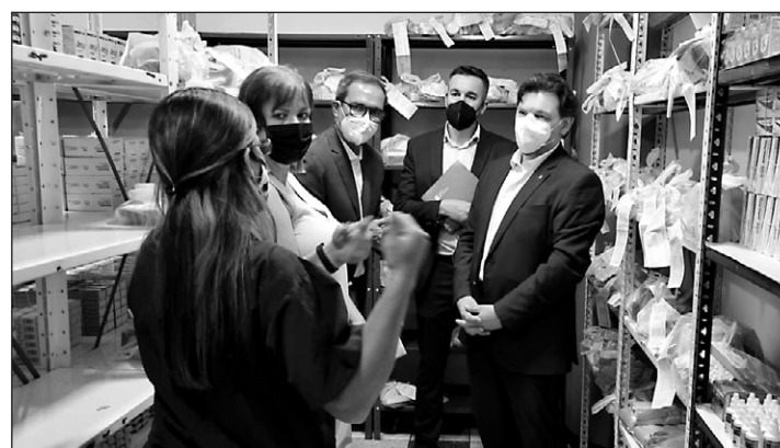
Miranda, durante su recorrido por las instalaciones de la HGV.

El secretario xeral de Emigración aprovechó también para visitar el Centro de Día de la Hermandad, en el que se presta servicio a medio