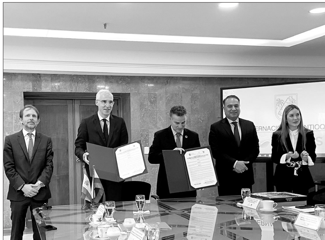
El vicepresidente económico de la Xunta firmó un acuerdo con el gobernador de Antioquía, Aníbal Gaviria.

De este modo, se abren vías de colaboración importantes de carácter recíproco y el reto que hay ahora por delante es el de saber identificar en qué ámbitos y proyectos Galicia y Colombia pueden ir de la mano, afirmó el vicepresidente gallego, quien apuntó también que las oportunidades de colaboración serán mayores “en