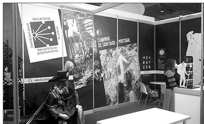
El Xacobeo mostró su excelencia en la feria.

La excelencia del turismo en Galicia también fue presentada por las Eurociudades de Galicia y Norte de Portugal, que presentaron su oferta en una simbiosis entre la Ruta Fluvial do Río Mlinho, la Ruta de las Fortalezas y la Reserva da Biosfera Gerês-Xurés, y que demuestran el éxito de las relaciones de cooperación que se han desarrollado entre Galicia y el Norte de Portugal.