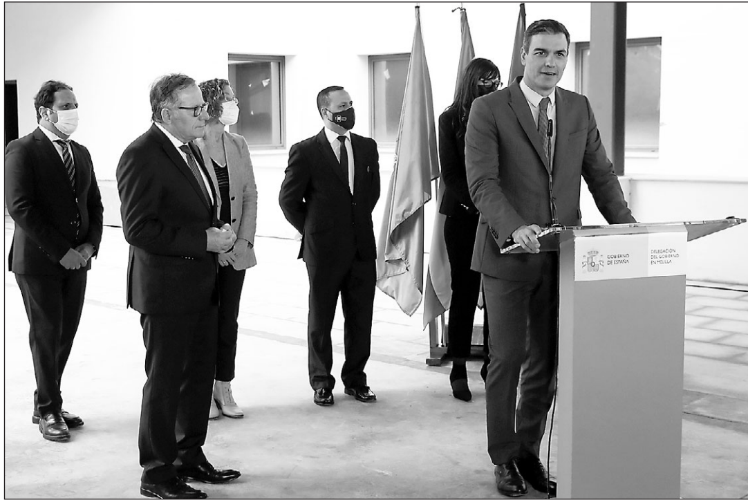
El presidente del Gobierno, Pedro Sánchez, ofreció una rueda de prensa al término de su visita a Melilla, donde puso en valor el acuerdo entre España y Marruecos.

La crisis bien podría cerrarse con el cambio de postura ahora del Gobierno de Sánchez sobre el Sáhara.