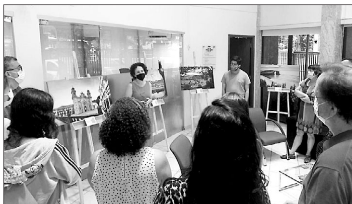
La muestra puede visitarse en el Cervantes de Recife hasta el 27 de abril.

Esta muestra se inauguró en Santos y posteriormente se trasladó a São Paulo, llegando ahora a Recife donde permanecerá hasta el próximo 27 de abril. La muestra recoge paisajes de las cuatro provincias gallegas, pudiéndose