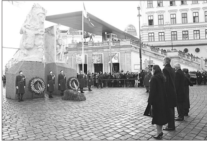
Los Reyes, durante la ofrenda floral a las víctimas españolas en Mauthausen.

Letizia, junto con el presidente federal y la primera dama, realizaron una ofrenda floral en memoria de todas las víctimas del nacionalsocialismo y en especial de las víctimas españolas en Mauthausen.