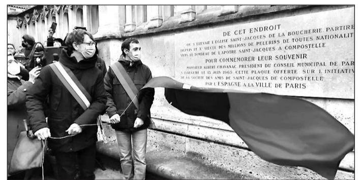
Inauguración de la restaurada placa del Camino de Santiago en París.

gas, se están mejorando las infraestructuras fluviales para acoger nuevos flujos turísticos al tiempo que se ponen en marcha actividades de promoción y creación de la ruta fluvial del río Miño que permita valorizar el patrimonio cultural y turístico con el que cuenta la Eurorregión.