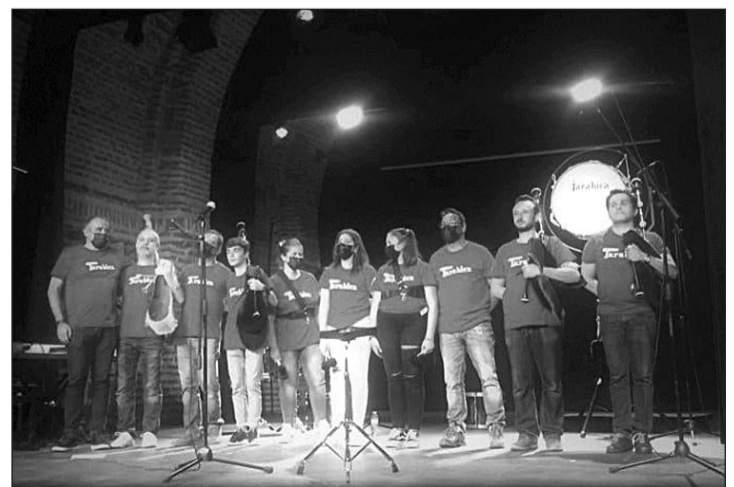
La banda de gaitas 'La Tabarica' participará en el XIII certamen celtibérico.