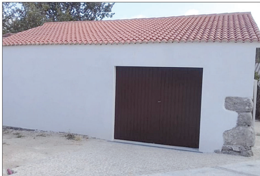
Vista de una edificación de Lobios antes —a la izquierda— y después de la intervención realizada con la ayuda de la Xunta.