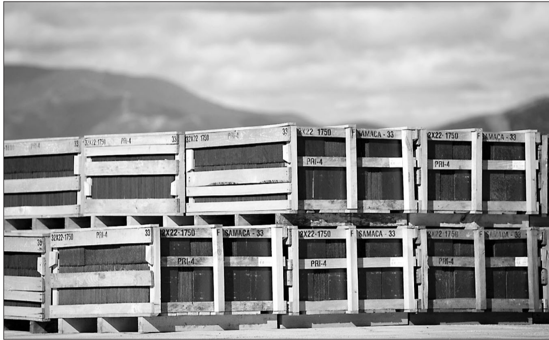
El porcentaje de incremento de las exportaciones de la Comunidad se sitúa un punto por encima de la media estatal.

En lo que respecta a los datos interanuales de noviembre, las ventas al exterior aumentaron este mes un 17,2% con respecto a noviembre del año pasado, su-