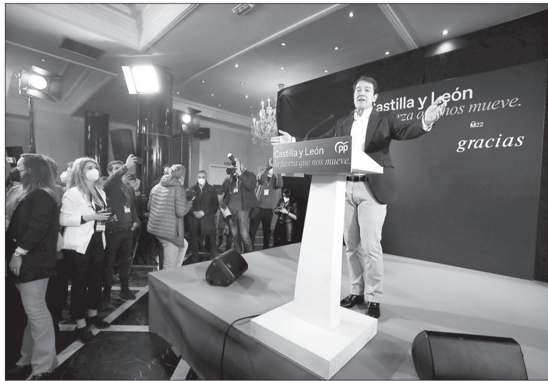
Alfonso Fernández Mañueco se dirige a los medios tras ganar las elecciones.

Vox, partido que encabeza Juan García Gallardo, obtuvo un excelente resultado, al pasar de 1 a 13, y el líder del partido a nivel nacional, Santiago Abascal, lo señaló durante su comparecencia tras