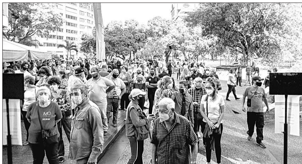
Españoles en Caracas guardan cola para votar en las elecciones al CRE de Venezuela, un país donde la cifra de inscritos en el CERA se redujo en más de 38.000 desde el 1 de enero de 2015.

En cuanto a las altas del año pasado, A Coruña contabiliza 1.726 más (un 1% por encima de lo que tenía) y se sitúa en cuarto