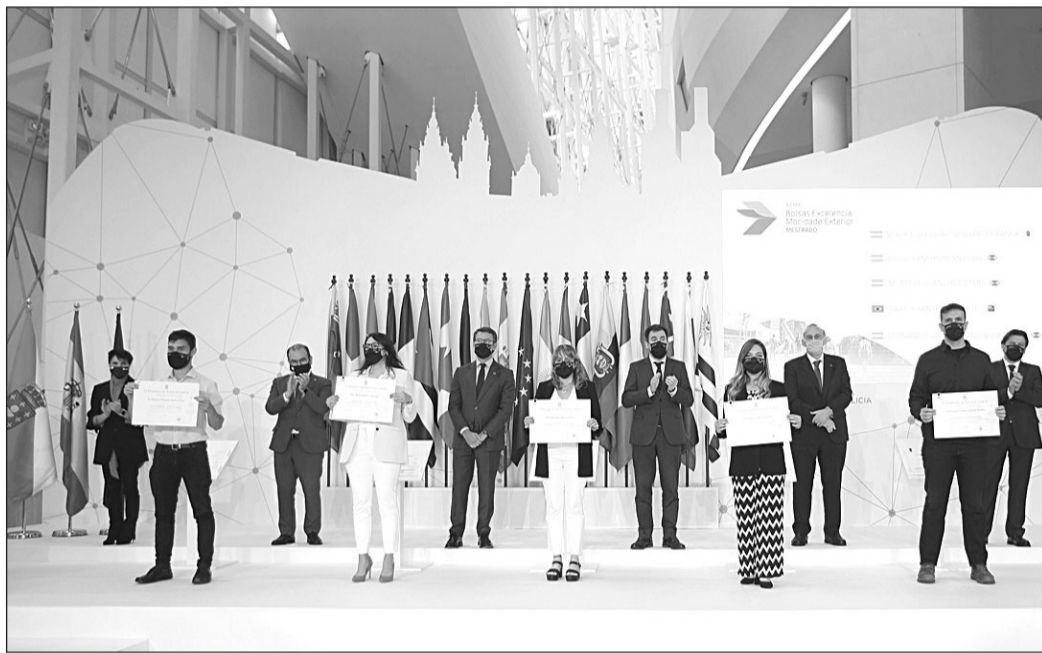
Autoridades de la Xunta, durante una ceremonia de entrega de diplomas a los participantes en las BEME.

Los interesados tienen hasta el próximo 29 de abril para presentar su solicitud. Toda la información puede consultarse en la página web de la Secretaría Xeral de Emigración: https://emigracion.xunta.gal .