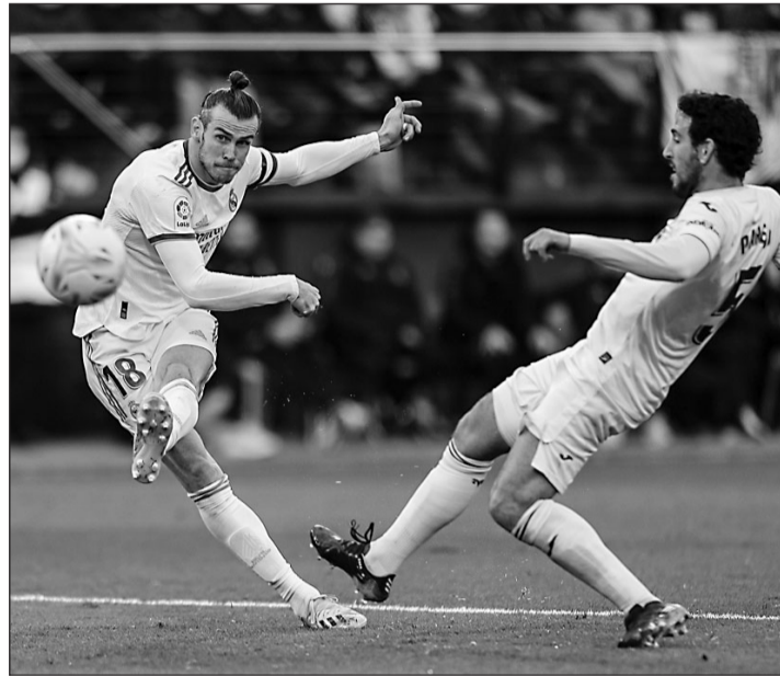
El madridista Bale dispara a portería ante la oposición de Parejo.

La noticia más llamativa en el inicio del encuentro fue la presencia de Bale en el Real Madrid para jugar como delantero centro en detrimento del centrocampista Luka