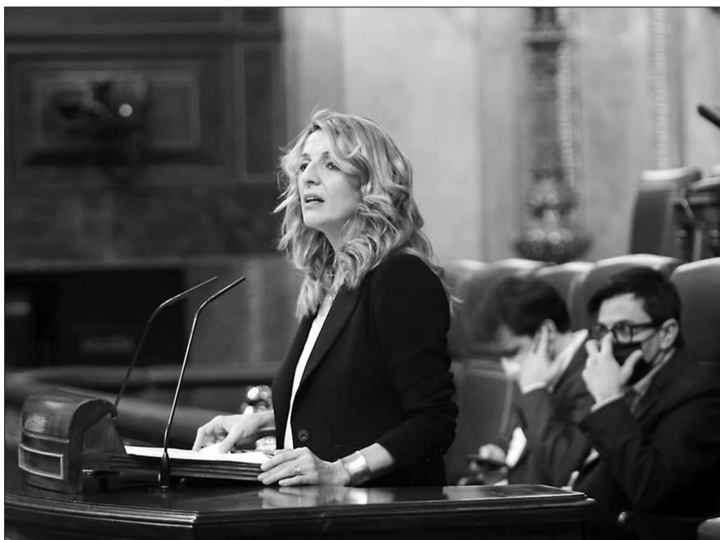
Yolanda Díaz defiende el real decreto-ley para la reforma laboral, durante la sesión del pasado día 3.

danía, sobre todo de los trabajadores y de cientos de miles de empresas que van a ver instrumentos de flexibilidad y seguridad jurídica para seguir creciendo y creando empleo", añadió Sánchez a la salida del Parlamento.