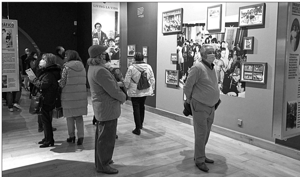
Los gijoneses pudieron visitar la exposición 'Emigrantes invisibles' hasta el pasado día 6.

"Ver a tanta gente recreándose en archivos ajenos, (re)tejiendo su propio relato familiar a partir de los hilos que hemos podido reunir de las historias de nuestros invisibles, ha sido fascinante. En Gijón he visto claramente cómo, más que objetos inertes expuestos ante un público pasivo, los componentes de 'Emigrantes invisibles', funcionan como máquinas, incubadoras o telares, puestas al alcance, y dispuestas para el uso de los visitantes", añade Fernández.