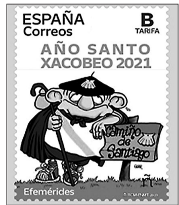
Sello de Correos identificativo.

incrementar las acciones en la Eurorregión. El vicepresidente primero se manifestó convencido de que ese aumento presupuestario está relacionado "con el buen aprovechamiento que en esta frontera estamos haciendo de los fondos comunitarios".