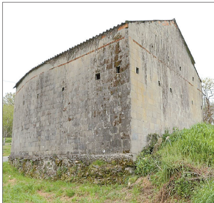
Vista de una casa de Vilalba antes —a la izquierda— y después de la rehabilitación llevada a cabo con la subvención de la Xunta.

Un total de 445 familias de 178 ayuntamientos mejoraron, el pasado año, sus inmuebles con las ayudas de la Xunta