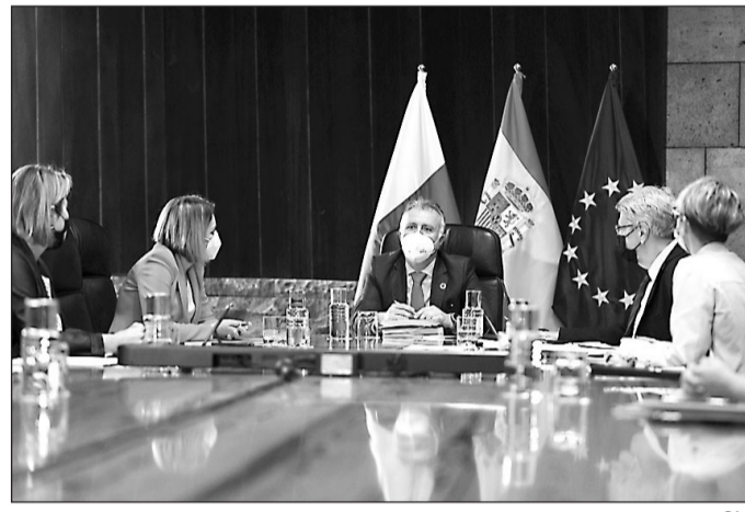
El Consejo de Gobierno, durante su reunión del pasado jueves.

La medida, impulsada por la Viceconsejería de Acción Exterior, aumenta la dotación del seguro médico de canarios o descendientes de isleños residentes en ese país y se dirige a los colectivos del tejido asociativo que atienden las necesidades básicas de los sectores más desfavorecidos de la población en estos momentos de crisis.