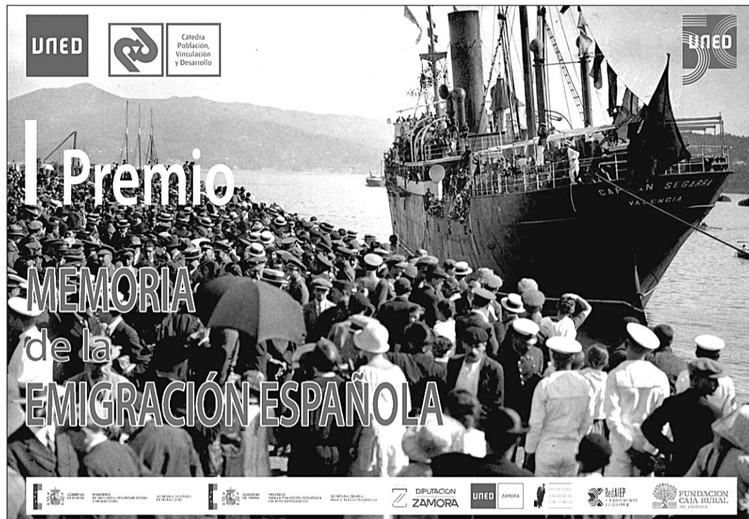
Cartel que anuncia la convocatoria del primer Premio de la Memoria de la Emigración Española.

El Premio, además de recoger los testimonios individuales, establece un premio especial para los relatos o documentales que plasmen la historia de las asociaciones o centros. “Lo que es la memoria institucional de la emigración son las asociaciones”, asegura Blanco, quien reconoce que en allí se agrupan “los emigrantes con más inquietudes, con más interés por mantener la vinculación con los lugares de donde salieron y con sus propios compatriotas”.