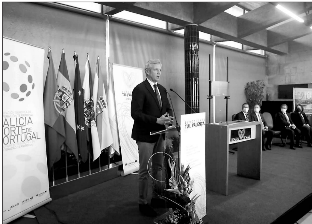
Alfonso Rueda, durante su intervención en el acto del 10º aniversario de la Eurociudad Tui-Valença.

En ese espíritu de colaboración, y con motivo de las jornadas celebradas por el aniversario, la AECT de la Eurorregión y la Eurociudad Tui-Valença firmaron un protocolo de colaboración por lo que la Eurorregión se compromete a defender los intereses y peticiones de la Eurociudad en foros como la