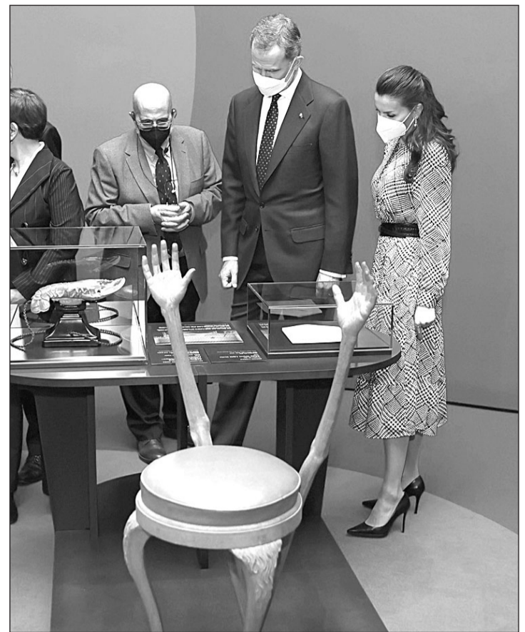
Don Felipe y doña Letizia, durante la inauguración de la exposición 'Dalí y Freud. Una obsesión'.

Más tarde, los Reyes inauguraron la exposición 'Dalí y Freud. Una obsesión' en el Museo Belvedere de Viena. La exposición, de la que es comisario el profesor Jaime Brihuega, explora la relación entre Salvador Dalí y Sigmund Freud y con ello la influencia recíproca en