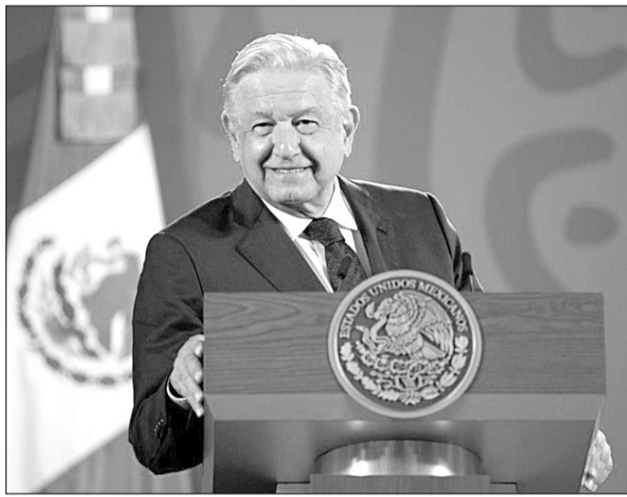
El presidente de México, Andrés Manuel López Obrador.

“Deberían de ofrecer hasta disculpas”, dijo, en relación a las empresas españolas. “No lo han hecho –prosiguió–, no importa, pero vamos a entrar en una etapa nueva despacio. Y repito, no es ruptura, es nada más decir ‘ha pasado esto’, y el pueblo de México debe saberlo y el