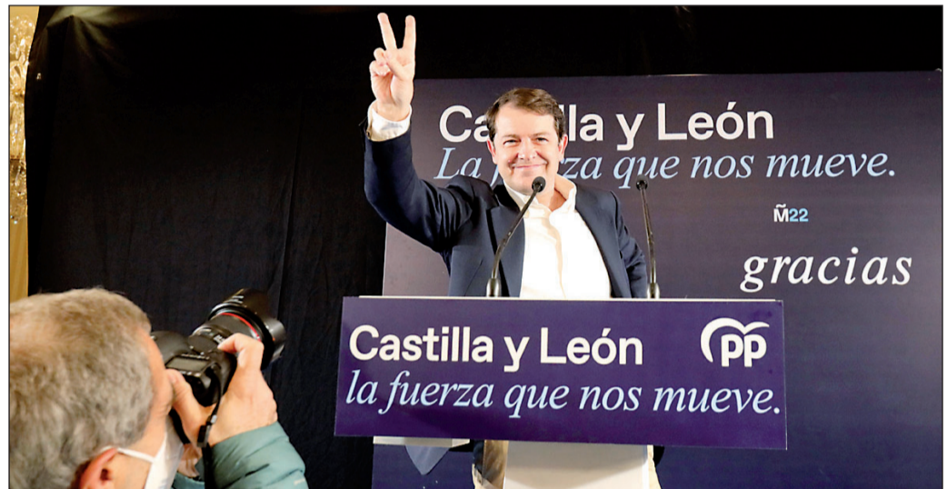
Alfonso Fernández Mañueco celebra el triunfo en las elecciones durante su comparecencia en la noche electoral. GM

El PP gana en Castilla y León, Vox logra 13 diputados y Cs se hunde