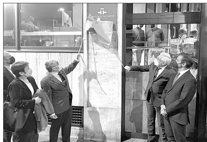
Las autoridades inauguran la extensión del Instituto Cervantes en Andorra.

El Instituto Cervantes está presente en 46 países del mundo contando con la nueva delegación del Principado.