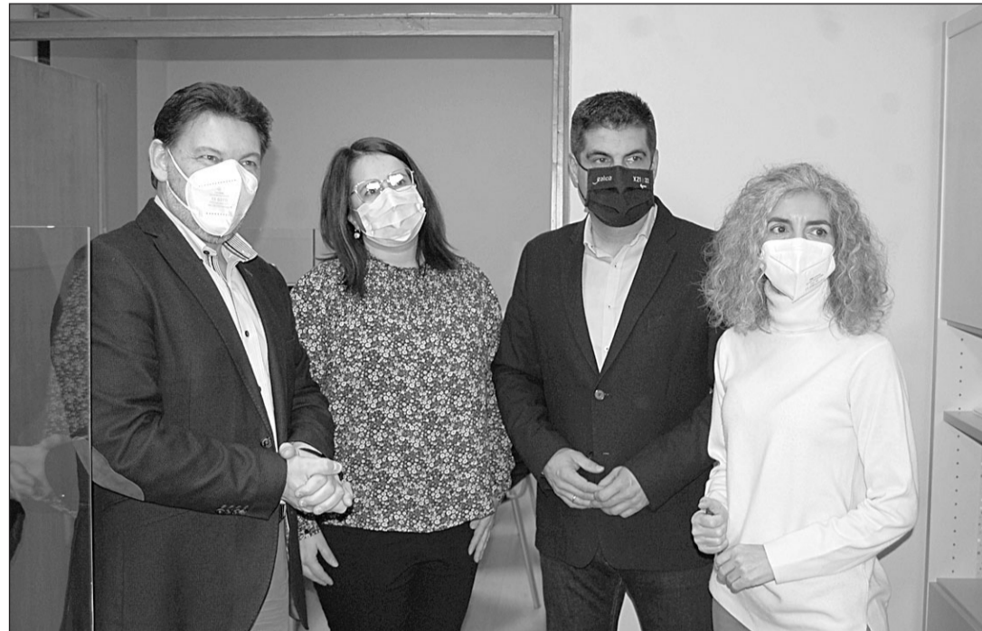
El secretario xeral de Emigración, durante la visita a la Oficina de Retorno de Ourense.

La puesta en marcha de estas oficinas de retorno formó parte de la anterior 'Estratexia Galicia Retorna'