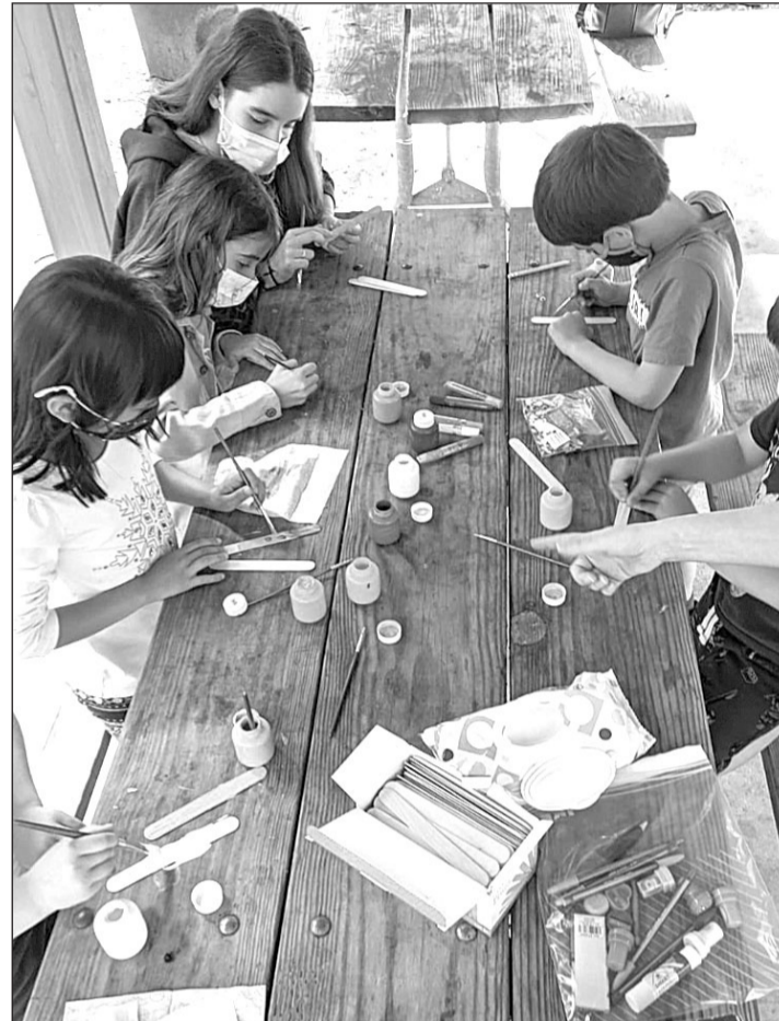
Una de las actividades realizada por la ALCE de Nueva York.

de Educación en Estados Unidos y Canadá, habrá ALCE en Nueva York, Washington y Montreal y su plazo de inscripción es del 20 de febrero al 20 de marzo.