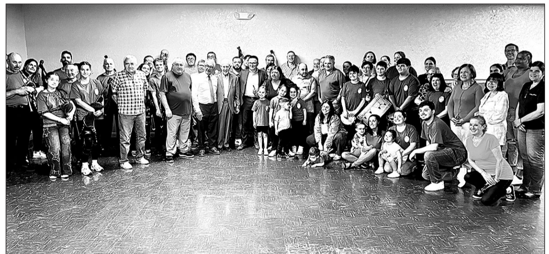
El conselleiro posa junto a los asistentes al encuentro en el Centro Ourenán de Newark.

En ese sentido, se refirió a Galicia como una tierra próspera y de oportunidades en la que la emigración supone un activo clave para seguir creciendo y forta-