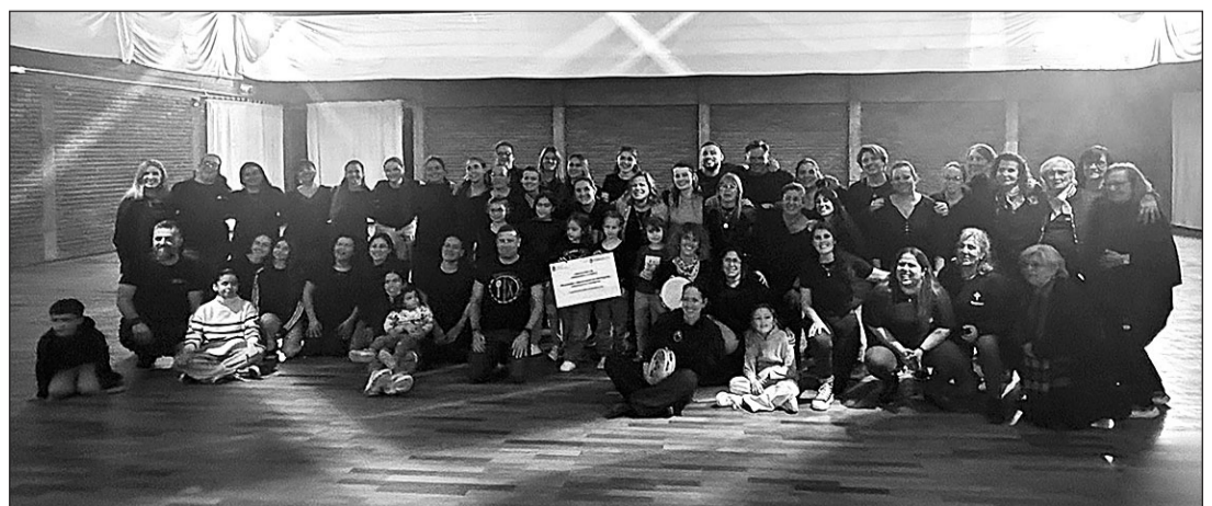
La delegada de la Xunta, con los alumnos y profesores del ‘obradoiro’ de pandereta y canto tradicional.

La actividad forma parte del esfuerzo conjunto por mantener viva la cultura gallega entre la colectividad en Uruguay y garantizar así la transmisión de las tradiciones a las nuevas generaciones.