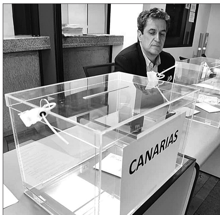
Urna de Canarias en el Consulado en Caracas en las últimas autonómicas.

Los mayores crecimientos de canarios en el CERA los primeros seis meses de este año se registraron en Cuba (1.528) y en Estados Unidos, que sumaron 1.030. Venezuela, por su parte, incorporó 62, cifra por debajo de Argentina, que sumó 183; Alemania, 113; Francia, 111 y Reino Unido, 95. Países Bajos añadió 53; México, 50; Chile, 45; Colombia, 33; Italia, 31; Brasil, 27, y República Dominicana, 20; mientras