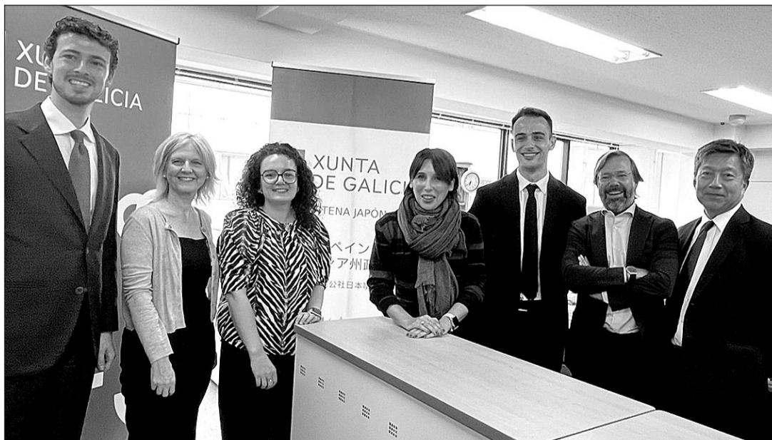
La conselleira y la directora del Igape, durante su visita a la Antena del Igape en Japón.

Al respecto, puso en valor la función de la Oficina Económica de Galicia como un órgano interlocutor del Gobierno gallego con las empresas, también del ámbito internacional, encargado de seguir de cerca las necesidades del tejido empresarial y de prestar un servicio de asesoramiento personalizado e integral. En ese sentido, apuntó que “todo proyecto con interés por instalarse en Galicia va a en-