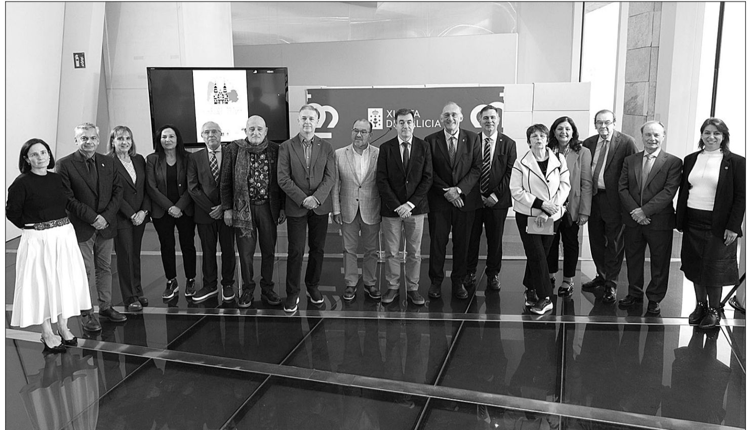
El conselleiro posa junto a las autoridades universitarias tanto de Galicia como de Argentina, en la jornada que tuvo lugar en la Cidade da Cultura.