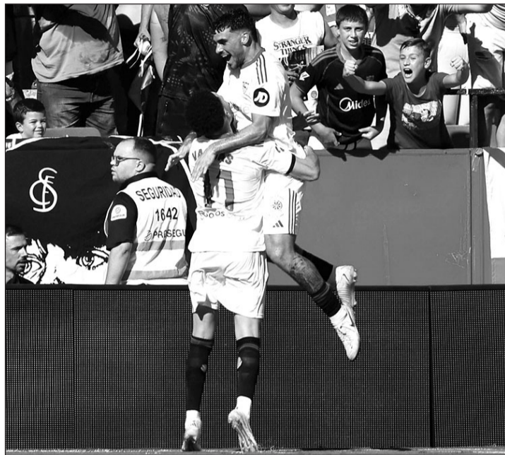
Dos jugadores del Sevilla celebran uno de los goles.