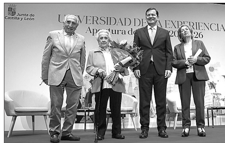
Fernández Mañueco presidió el acto de inicio del curso.

Este programa de voluntariado representa el compromiso solidario de la ciudadanía de Castilla y León y actúa como vehículo para promover valores como la convivencia, la participación, la tolerancia y el aprendizaje compartido. Asimismo, reconoce y pone en valor la labor de las ONG, que lideran y coordinan las acciones en destino gracias a su experiencia y conocimiento profundo de los contextos en los que actúan.