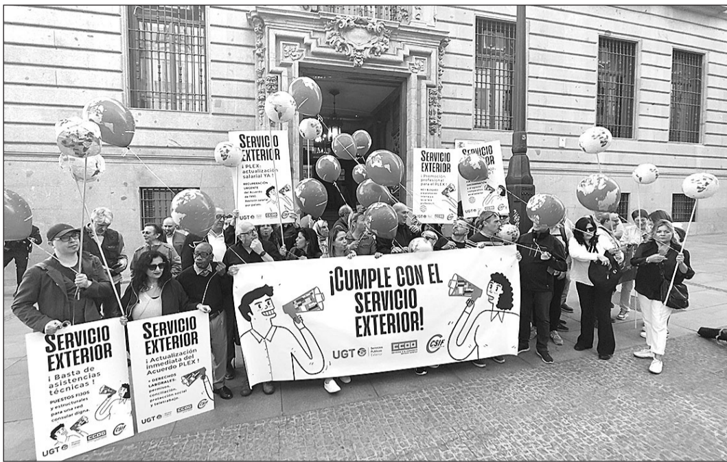
Participantes en la concentración ante el Ministerio de Hacienda, en Madrid.