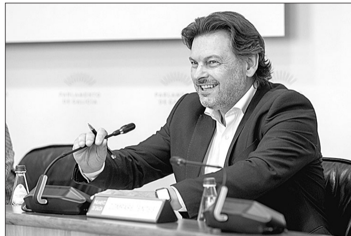
El secretario xeral de Emigración pidió al Gobierno central que asuma el retorno como política de Estado.

tuvo acompañado por sus nietas, participantes de los programas de retorno de la Xunta, en las becas BEME (Bolsas Excelencia Mocidade Exterior), y la otra en Formación Profesional. Ambas compartieron con el responsable autonómico de Emigración su experiencia académica en Galicia, subrayando la oportunidad que les brindó