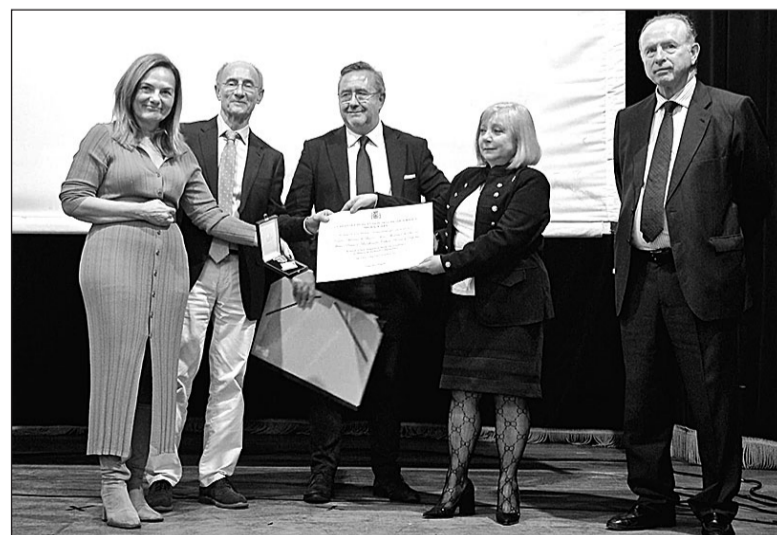
La presidenta del Centro Asturiano recibe de manos de la directora general la Medalla de Honor y el Diploma de Reconocimiento al Mérito. M.R.

“Estamos trabajando en una batería de medidas muy amplias, que incluyen ayudas para el emprendimiento, la búsqueda de empleo y la creación de asociaciones de retornados”, explicó la funcionaria. Además, adelantó que se están desarrollando programas junto a otros ministerios