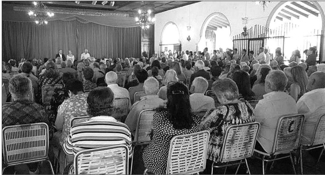
Uno de los objetivos de la futura Ley de Canariedad es actualizar los cauces de participación de las comunidades canarias del exterior.

Los objetivos fundamentales que se persiguen con la actualización de la Ley es ampliar su alcance y los cauces de participación y apoyo entre las comunidades canarias asentadas fuera de Canarias con el pueblo canario y sus instituciones.