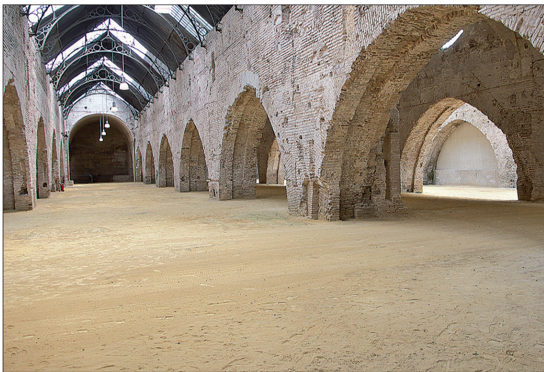
Las Atarazanas de Sevilla es un edificio monumental de más de 7.000 metros cuadrados, con amplias naves.

Sin embargo, los políticos no son los únicos en pisar suelo en el emblemático edificio antes de la inauguración oficial. Una vez acabado el proceso de rehabilitación, se abrieron sus puertas para