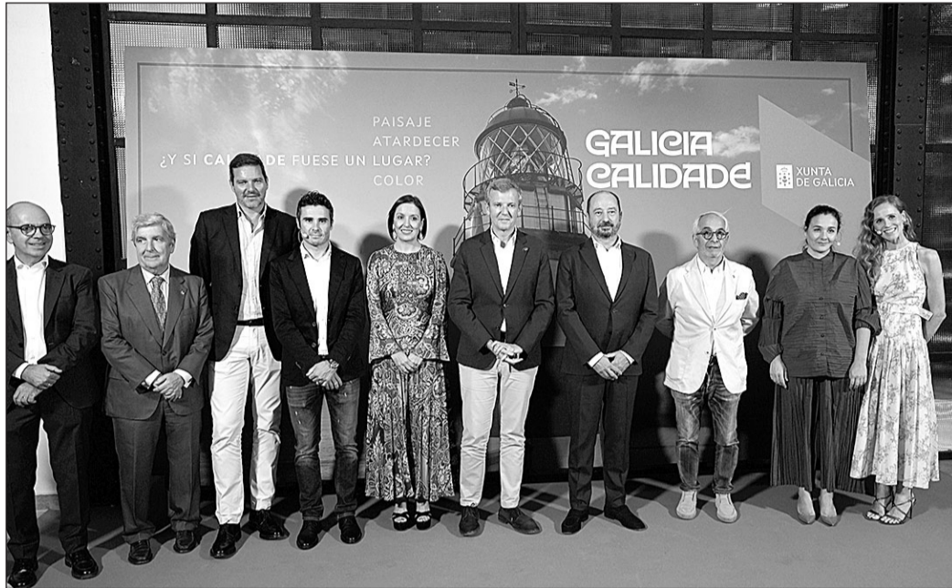
Alfonso Rueda, José Carlos López Campos y Xosé Merelles, con otras autoridades e invitados.

El titular del Ejecutivo gallego, que estuvo acompañado por el conselleiro de Cultura, Lingua e Xuventude, José López Campos, y por el director de Turismo de Galicia, Xosé Merelles, destacó que la campaña nace con el objetivo de ser no solo una promoción turística, sino esa marca-país, que muestre la Mereforma de hacer las cosas en