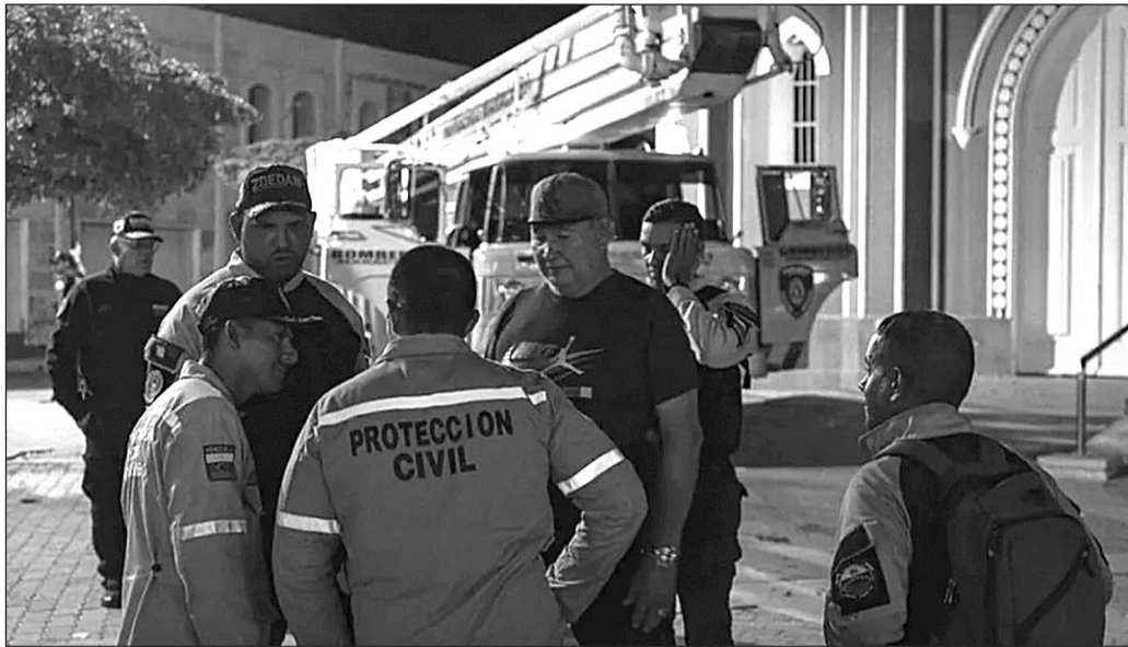
Los servicios de protección civil evalúan los posibles daños del terremoto en Venezuela.