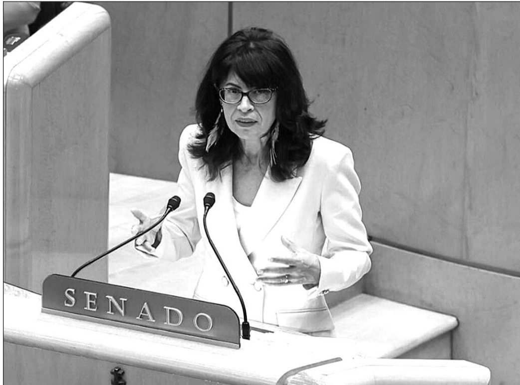
La ministra Ana Redondo, durante su comparecencia en el Senado.

La comparecencia de la ministra tuvo lugar una semana después de que el Congreso la haya reprobado y en un contexto en el que la oposición pide su dimisión.