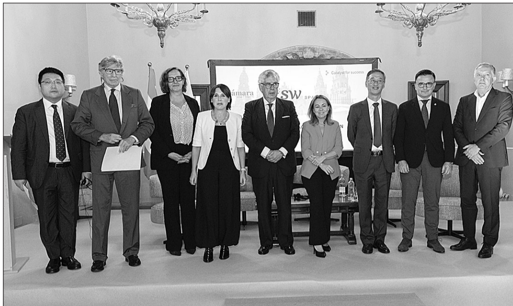
Las autoridades participantes en el foro empresarial.

El titular de Emprego, Comercio e Emigración destacó que Galicia actúa como una administración facilitadora para su tejido empresarial, comprometida con la simplificación de trá-