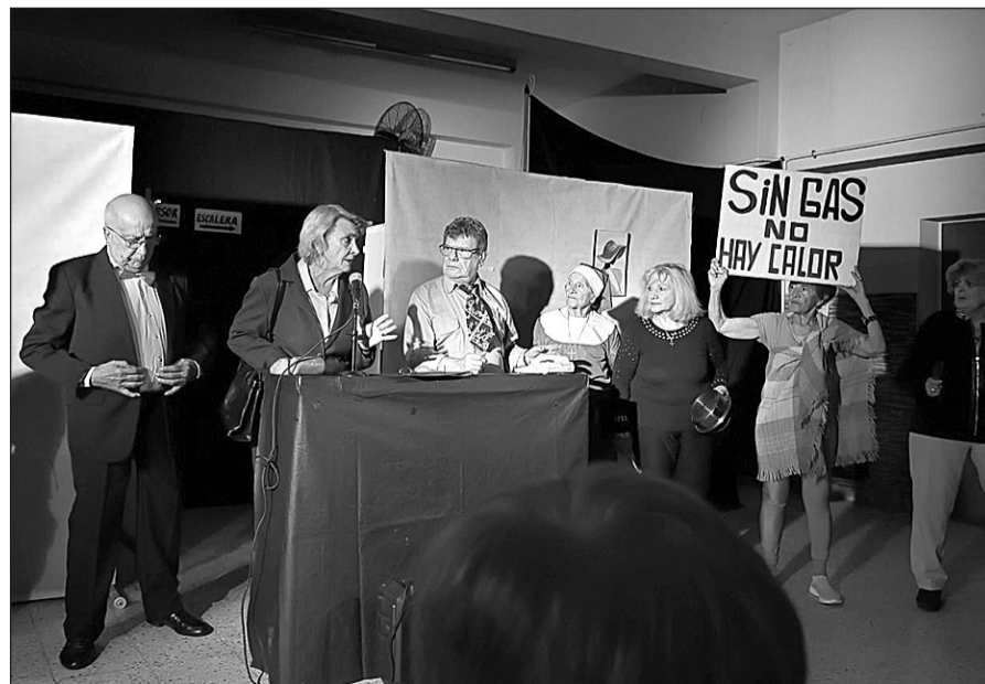
El grupo de teatro del Centro Andaluz de Bahía Blanca representando la obra.

También se presentó el grupo de castañuelas ‘Las Castañitas’, interpretando distintos temas musicales, los cuales fueron ovacionados por el público presente.