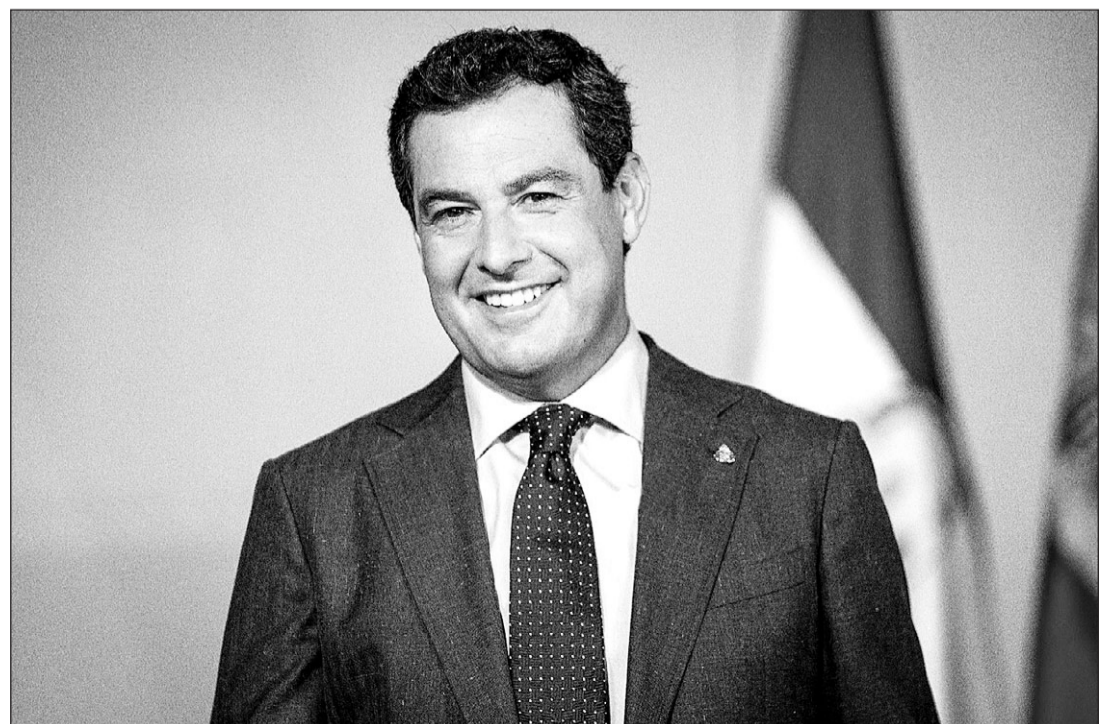
El presidente de la Junta, Juanma Moreno, durante el mensaje a los andaluces en el exterior.