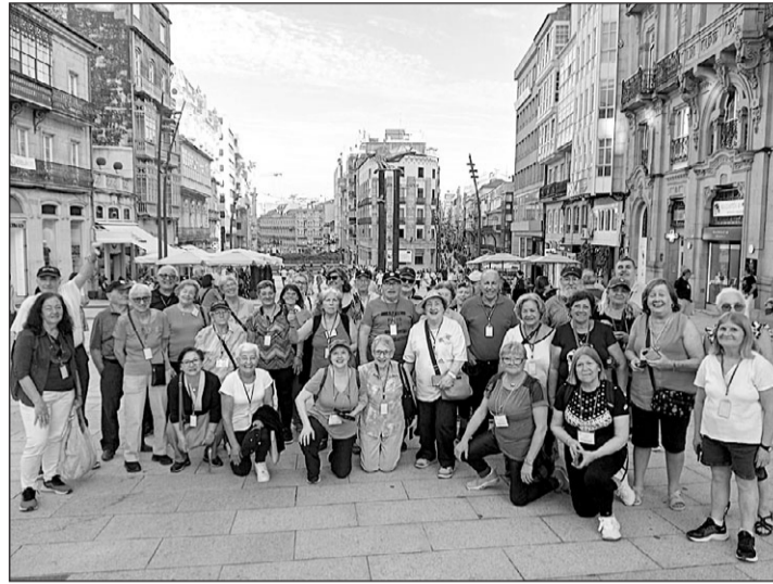
Participantes en el programa 'Reencontros' en su visita a Vigo.

'Conecta con Galicia' y 'Conecta co Xacobeo', para los más jóvenes, y 'Reencontros', desti-