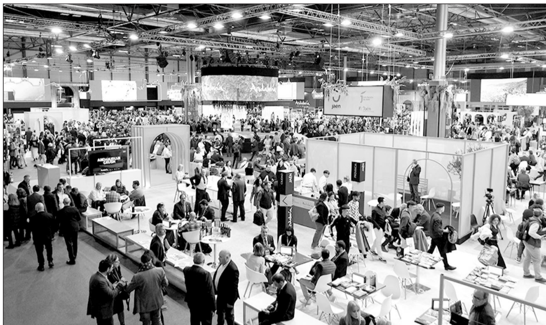
La Oficina de la Junta en Madrid ha ayudado a la organización del pabellón de Andalucía en la edición de Fitur.

Las oficinas de la Junta de Andalucía en Madrid y Barcelona, que tienen encomendadas las funciones de difusión, promoción y representación institucional de Andalucía en sus respectivos ámbitos geográficos, vienen desarro-