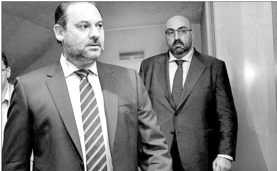
Fotografía de archivo, tomada el 5 de agosto de 2019, en la que se ve a Koldo García —a la dcha.—, junto al entonces ministro de Fomento, José Luis Ábalos (i).

La investigación obedece al cobro de sobornos en adjudicaciones de mascarillas en los peores meses de la pandemia. Las