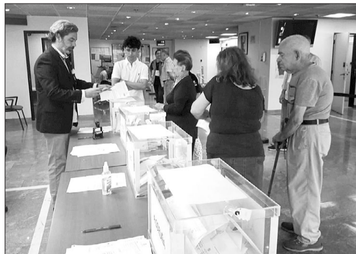
Un votante ejerce su derecho al sufragio en el consulado de Caracas.

La poca participación se puede justificar que al ser una elección autonómica no llame tanto la atención como unas elecciones generales, y por ser asueto de Carnaval, que es festivo en toda Venezuela, el 11 y 12 de febrero.