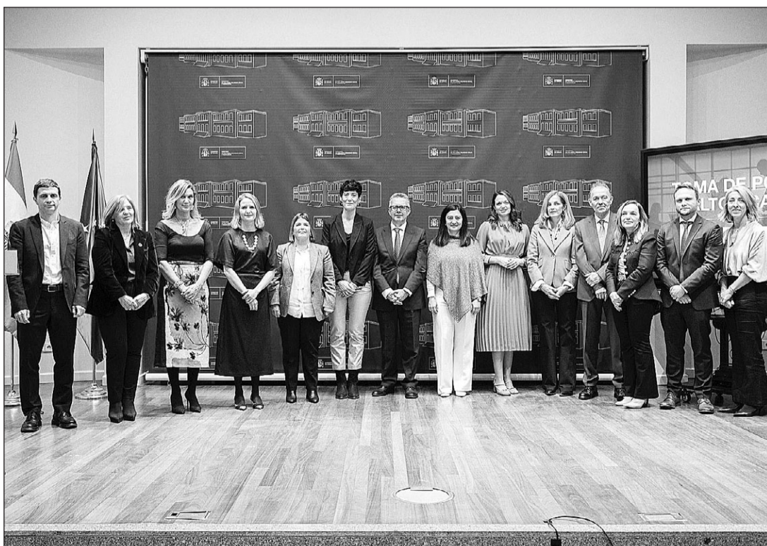
La ministra Elma Saiz presidió el acto de toma de posesión de los altos cargos de su Ministerio.

En su cuenta de X, Pilar Cancela dio las gracias a la ministra Saiz “por refrendar su confianza” y añadió que capitanea “un gran equipo para un tiempo de grandes retos para el bien común, sobre todo para los más vulnerables”.