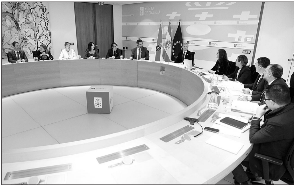
El Consello de la Xunta autorizó el convenio entre la Secretaría Xeral de Emigración y la Fundación Ronsel.

La Xunta autorizó la firma de un convenio por 200.000 euros