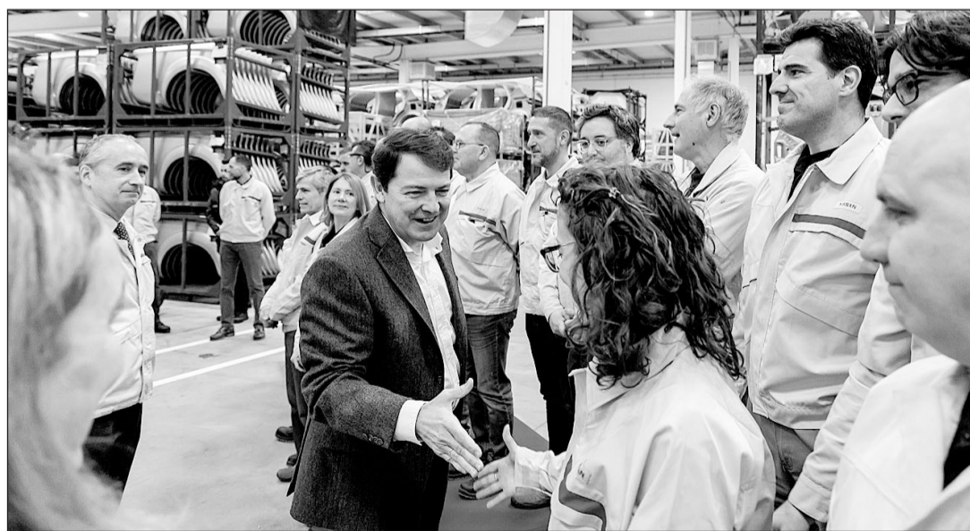
Fernando Mañueco saluda a los trabajadores durante su visita a Nissan en Ávila.

El presidente de la Junta ha recordado que el sector de la automoción