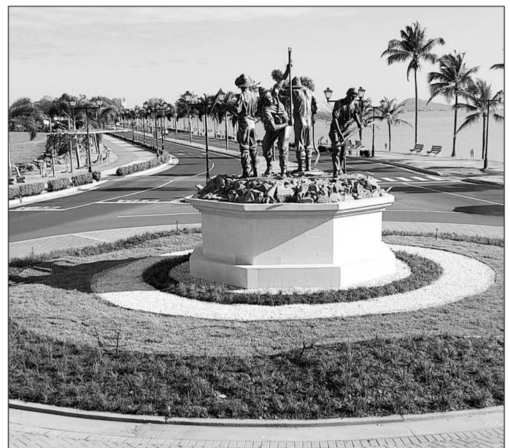
El monumento inaugurado preside una rotonda en Ciudad de Panamá.