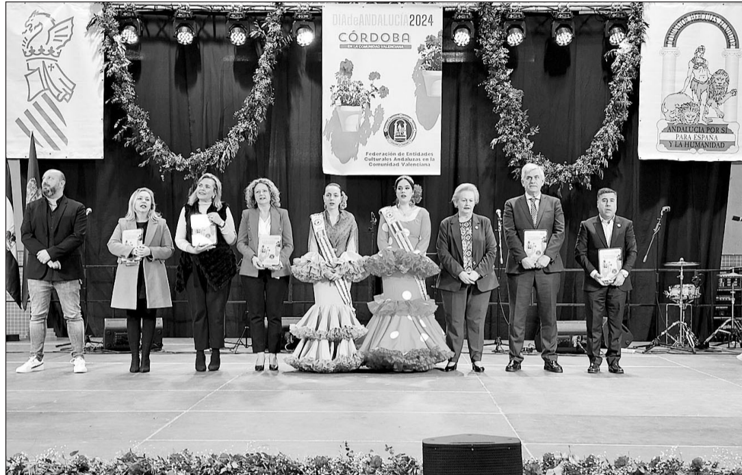
La presidenta de la entidad, junto a las autoridades participantes, la Reina y la Dama de la entidad y el Andaluza del Año, durante la celebración del Día de Andalucía en Valencia.