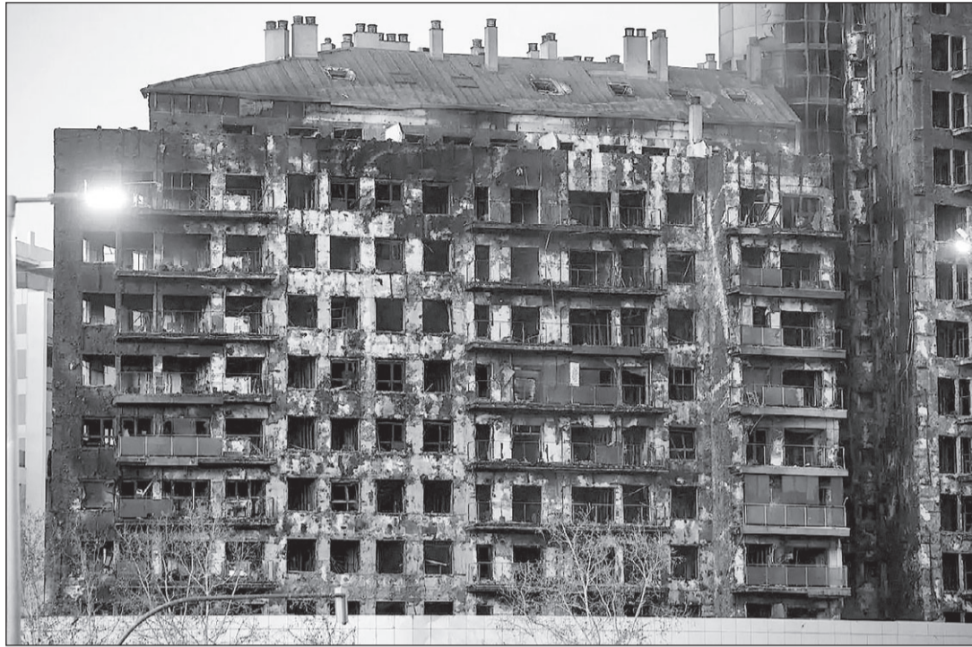
La luz del día al día siguiente mostró la devastación provocada por el incendio.

La luz del día al día siguiente mostró la devastación provocada por el incendio, que en poco tiempo quemó las 138 viviendas del