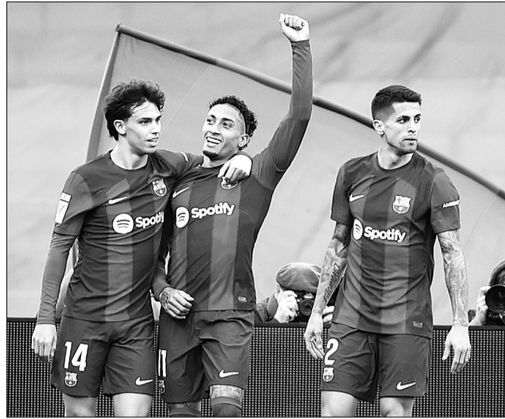
Los jugadores del Barcelona celebran uno de los goles.

Las mejores ocasiones azulgranas no llegarían a balón parado, sino con pelotazos largos a sus delanteros para superar la zaga azulona, que dejaba muchos metros a su espalda cada vez que apretaba arriba a su rival. Por ejemplo, en la jugada