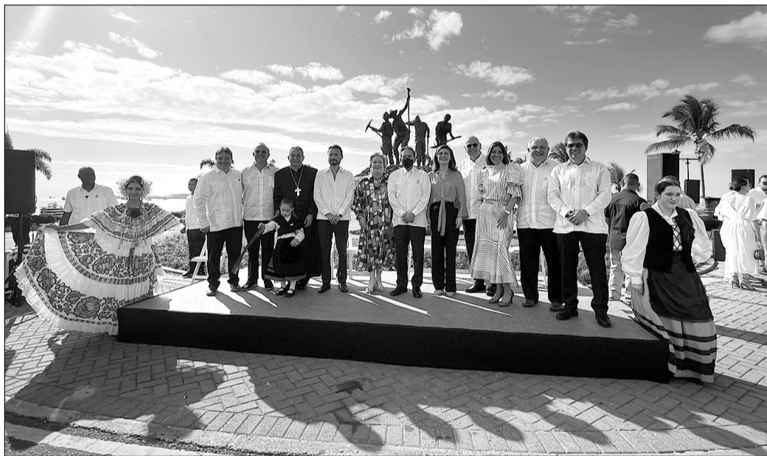
Las autoridades presentes tras la inauguración de la escultura.