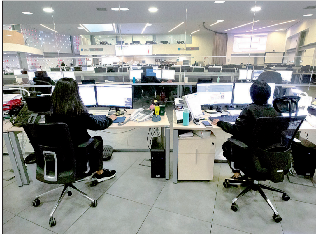
Trabajadores del 112 recogen incidencias durante una jornada laboral en el CIAE.

La Administración autonómica gallega trabaja también activa-