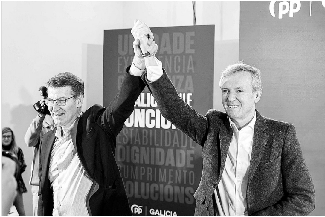
El presidente del PP nacional, Alberto Núñez Feijóo, proclama como ganador de las elecciones a Alfonso Rueda.

a la falta de respaldo del electorado hacia los socialistas que es tendencia en cada cita en los territorios desde que Sánchez ocupa el Gobierno, como quedó de manifiesto en los comicios del pasado mes de mayo, cuando perdió plazas como Valencia, Canarias, Extremadura, Aragón y Baleares. El PP, por su parte, pese a perder dos representantes con respecto a 2020, consiguió su propósito de seguir al frente de la Xunta, mientras que el aumento del BNG, que pasó de 19 a 25 diputados, resultó insuficiente para propiciar el cambio de rumbo que promulgaba su líder.