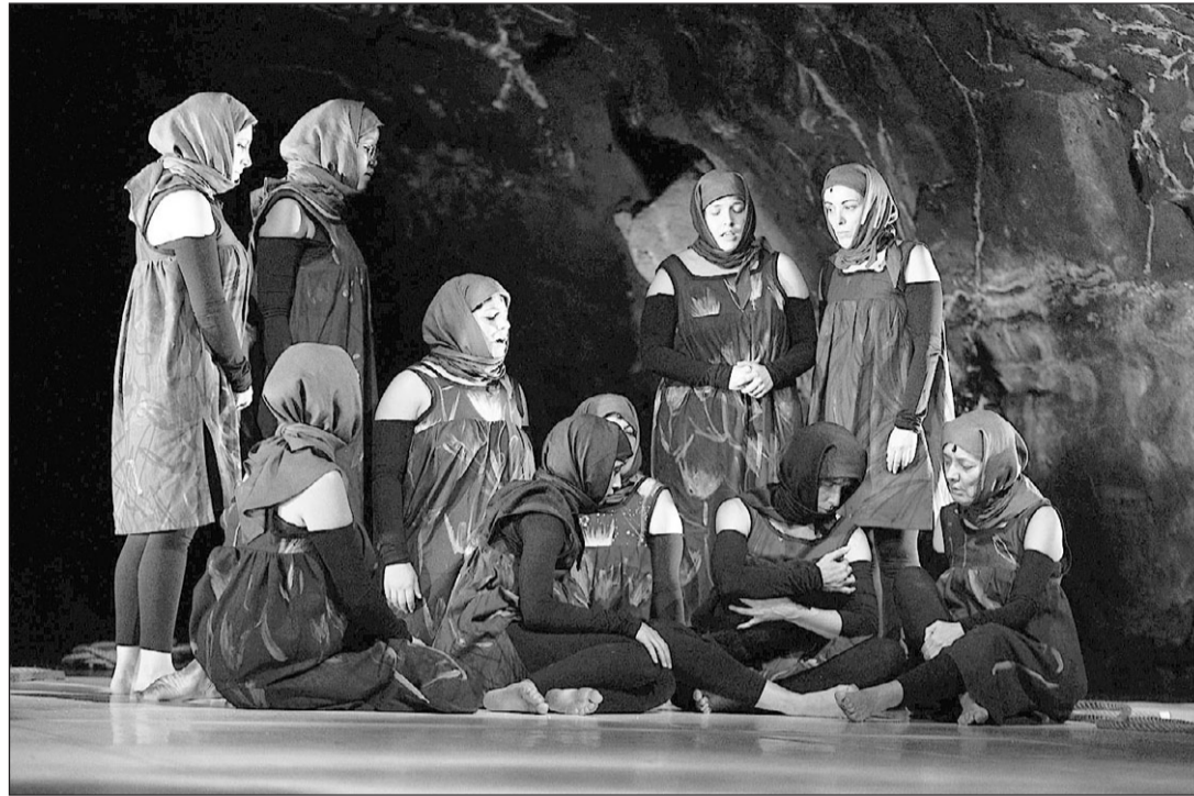
Escenas de danza, música y teatro conformaron el espectáculo diseñado en honor del intelectual lanzaroteño.