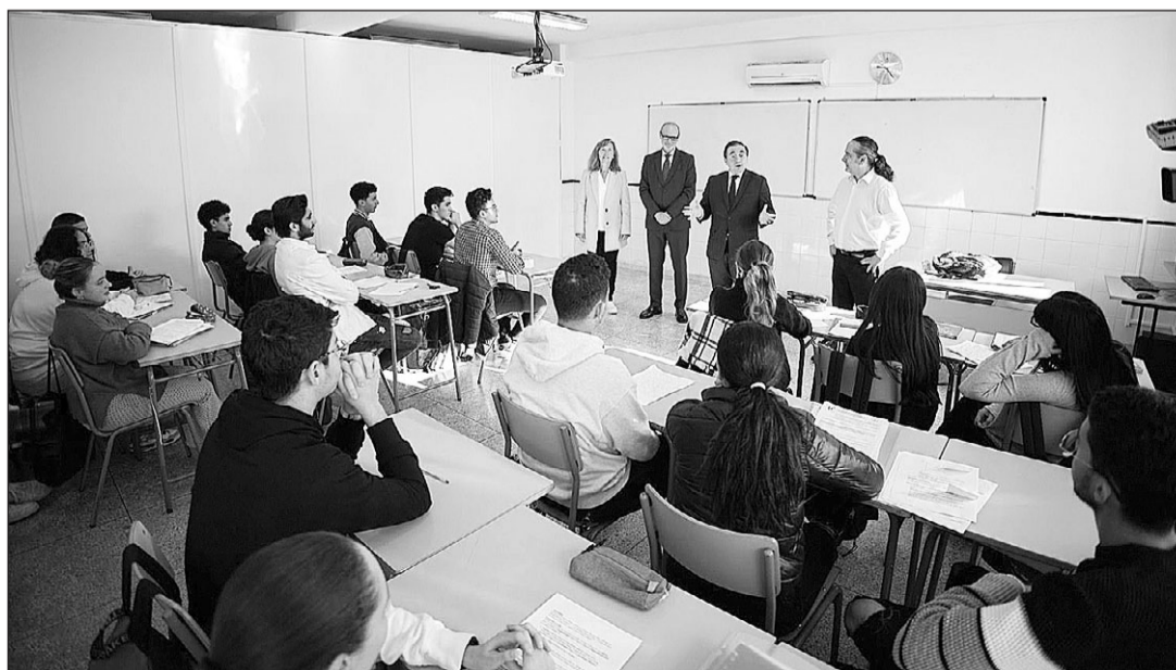
José Manuel Albares se dirige a alumnos del Colegio Español de Rabat.

Posteriormente, se reunió con su homólogo Naser Burita, con quien celebró un encuentro bilateral en el