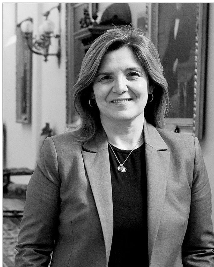
Pilar Cancela, nueva secretaria de Estado de Migraciones, en un pasillo del Congreso de Diputados.

ha desarrollado en torno al municipalismo, habiendo trabajado en áreas de desarrollo económico y empleo en diferentes administraciones locales y autonómicas, además de impulsar proyectos europeos con la responsabilidad de la gestión de subvenciones de carácter internacional.