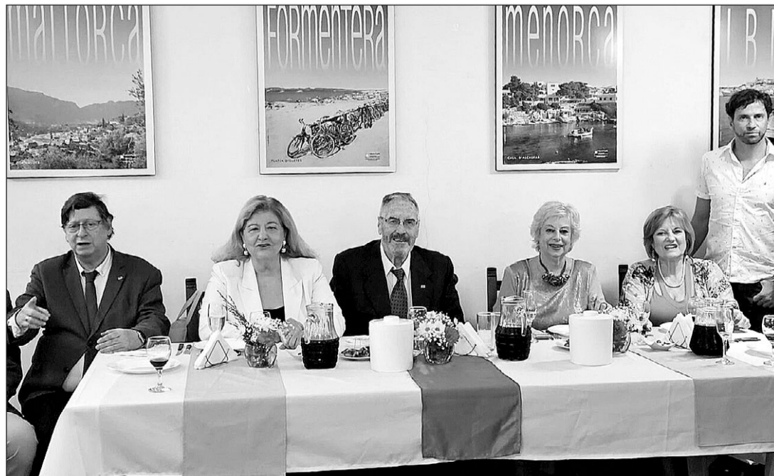
Las autoridades en la mesa presidencial del evento por el aniversario del Centro.

Compartieron un estupendo asado, amenizado con música.