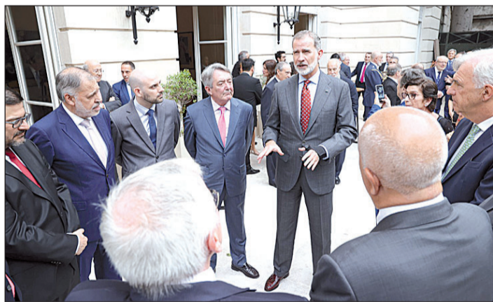
El Rey se dirige a un grupo de asistentes a la recepción en la Embajada.