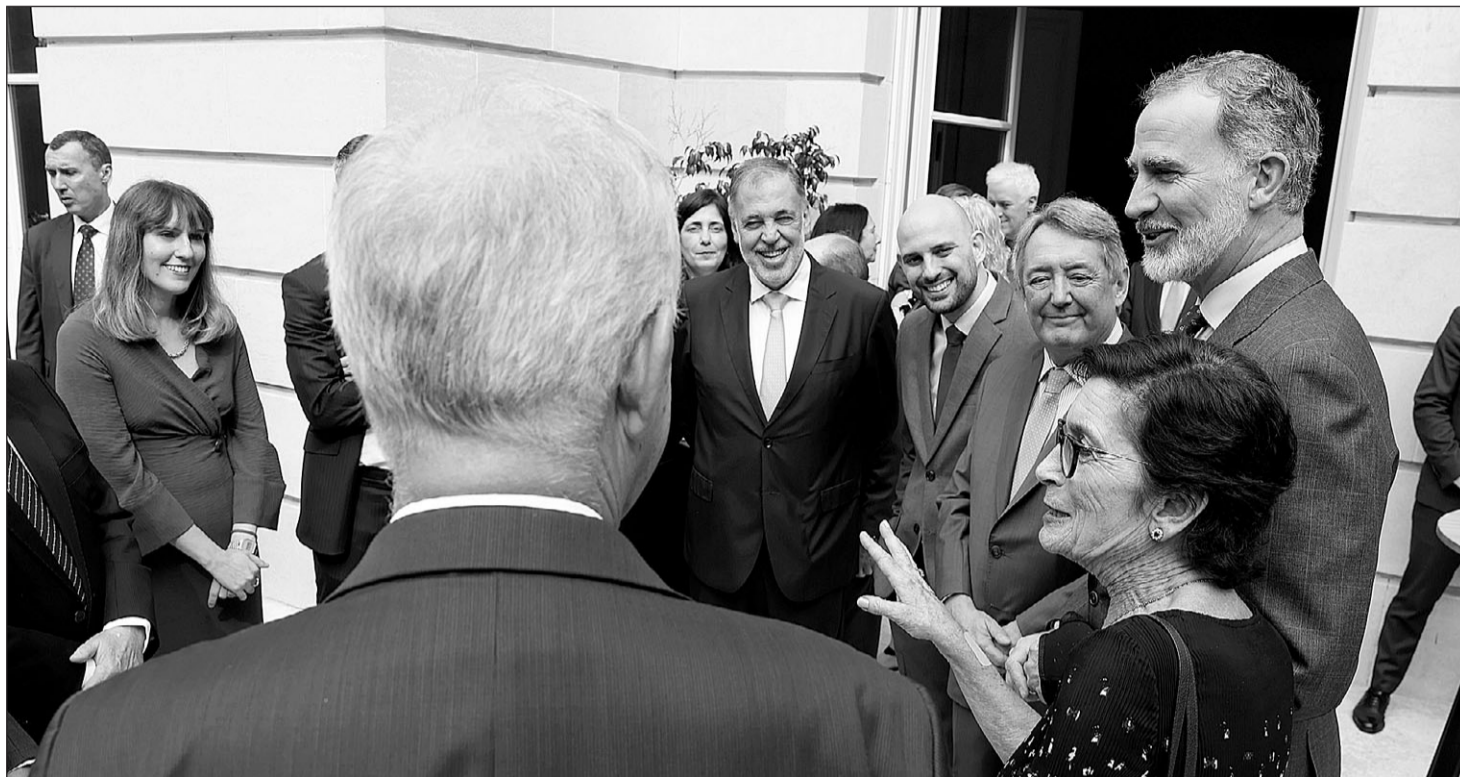
La embajadora de España, junto al Rey, dirige unas palabras a los asistentes a la recepción.

“Comentamos los problemas, las dificultades que va a tener que enfrentar Argentina y cómo serían las posibles soluciones”, explicó Mondino a los periodistas presentes en la Cancillería argentina, al tiem-