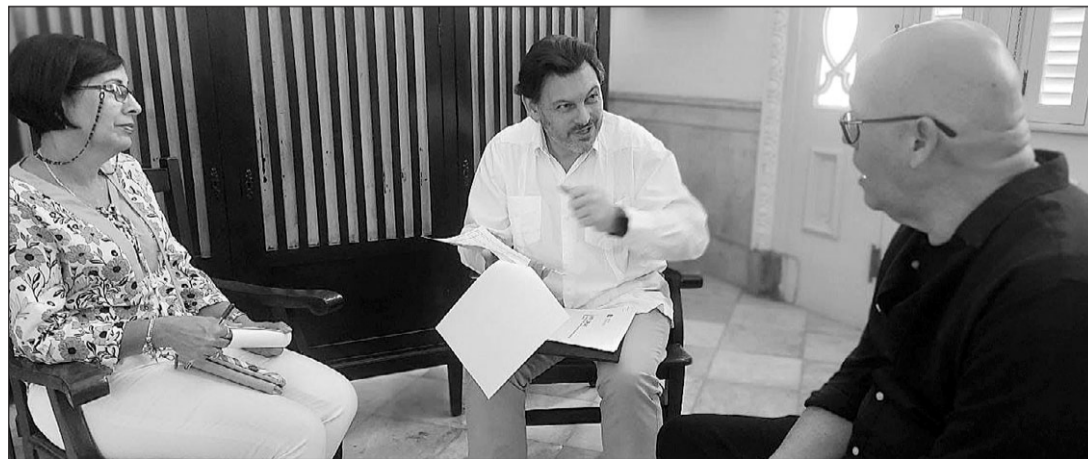
El secretario xeral conversó sobre distintos temas con los responsables de la Sociedad Naturales de Galicia.

dad para reconocer la labor histórica de la sociedad que, desde sus primeras reuniones hasta el presente, mantiene inalterables sus ideales benéficos, sirviendo de modelo de compromiso y entrega a la comunidad gallega en Cuba.