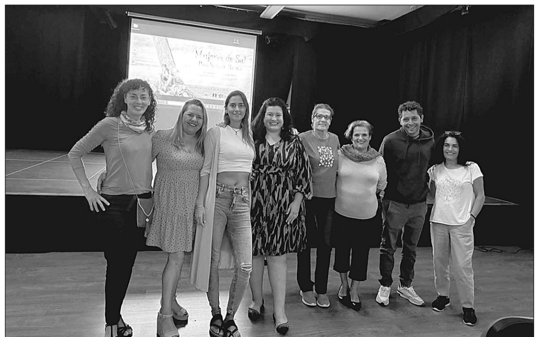
Asistentes al evento celebrado en Pájara.

Las personas interesadas pueden consultar el 'teaser' de este documental a través del siguiente enlace: https://youtu.be/bzdKHA4IHrw?si=k2D7YT0w4_KO BpmY .