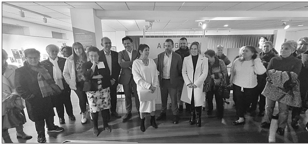
El secretario xeral de Emigración, la presidenta del Consello da Cultura Galega y el alcalde de Miño, entre las autoridades que asistieron a la inauguración.

La muestra incluye imágenes, objetos personales y documentos que narran historias de lucha, adaptación y éxito de la