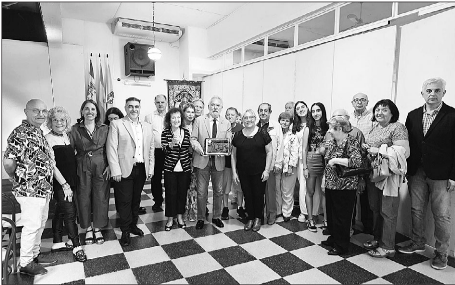
El presidente del Parlamento posa con directivos y socios del Centro Partido de Carballiño.