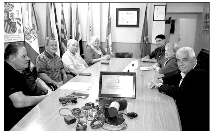
Reunión de directivos de la Federación castellana y leonesa de Argentina y de la Federación Regional de Sociedades Españolas en Bahía Blanca. CYLM