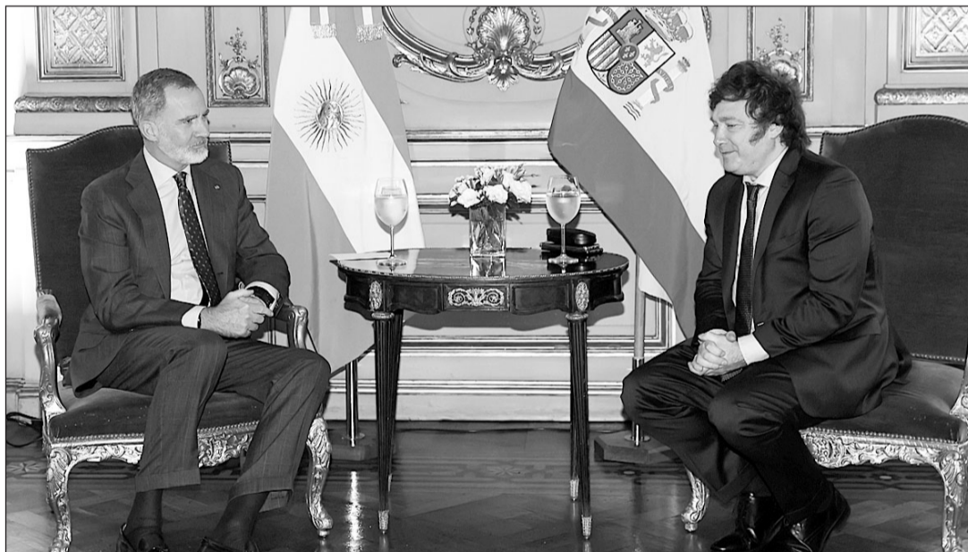
El Rey y Javier Milei conversan en la reunión que mantuvieron en la víspera de la investidura.

po que recordó que España es el segundo inversor extranjero de Argentina.