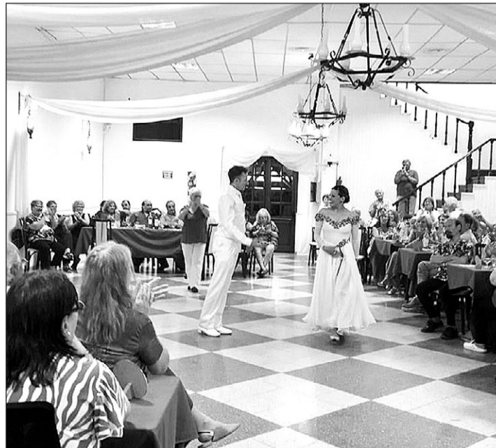
Los asistentes pudieron observar un espectáculo de danzas.

Hubo brindis para despedir el año, a cargo del presidente de la entidad, quien agradeció a los presentes y deseó unas muy buenas fiestas y un próspero año 2024.