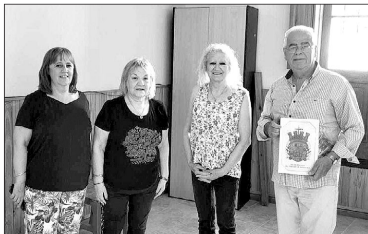
Directivos de la Federación y de la Asociación Española de Carmen de Patagones, durante el encuentro que mantuvieron.