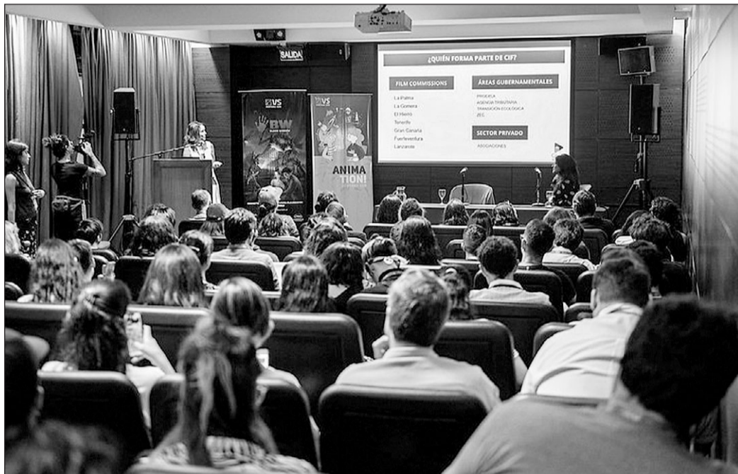
Presentación de Canary Islands Film en 'Ventana Sur', encuentro que se celebra en Argentina.

Durante el mismo se compartieron detalles de la convocatoria y del programa, con el objetivo de captar tanto guionistas como productoras inte-