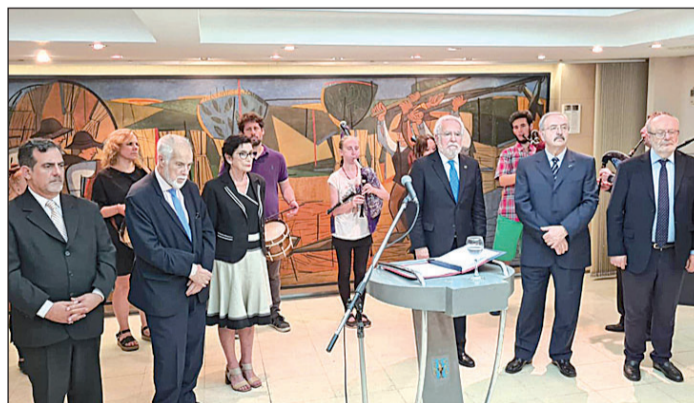
El presidente del Parlamento gallego, Miguel Ángel Santalices, junto a otras autoridades en la inauguración de la exposición en Buenos Aires