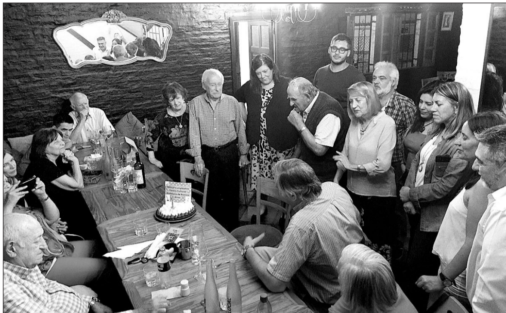
Asistentes al encuentro por el 27º aniversario del Centro Andaluz.