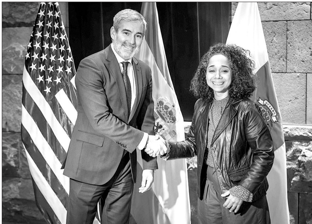
Fernando Clavijo y Julissa Reynoso se saludan al inicio de su encuentro, en Santa Cruz de Tenerife.

En cuanto a los proyectos de colaboración, el presidente de Canarias ha expuesto a la embajadora norteamericana "las enormes oportunidades" existentes en campos asociados al cambio climático y al calentamiento global, poniendo en va-