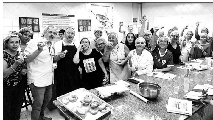
Los participantes en el curso y su profesor prueban los dulces cocinados.