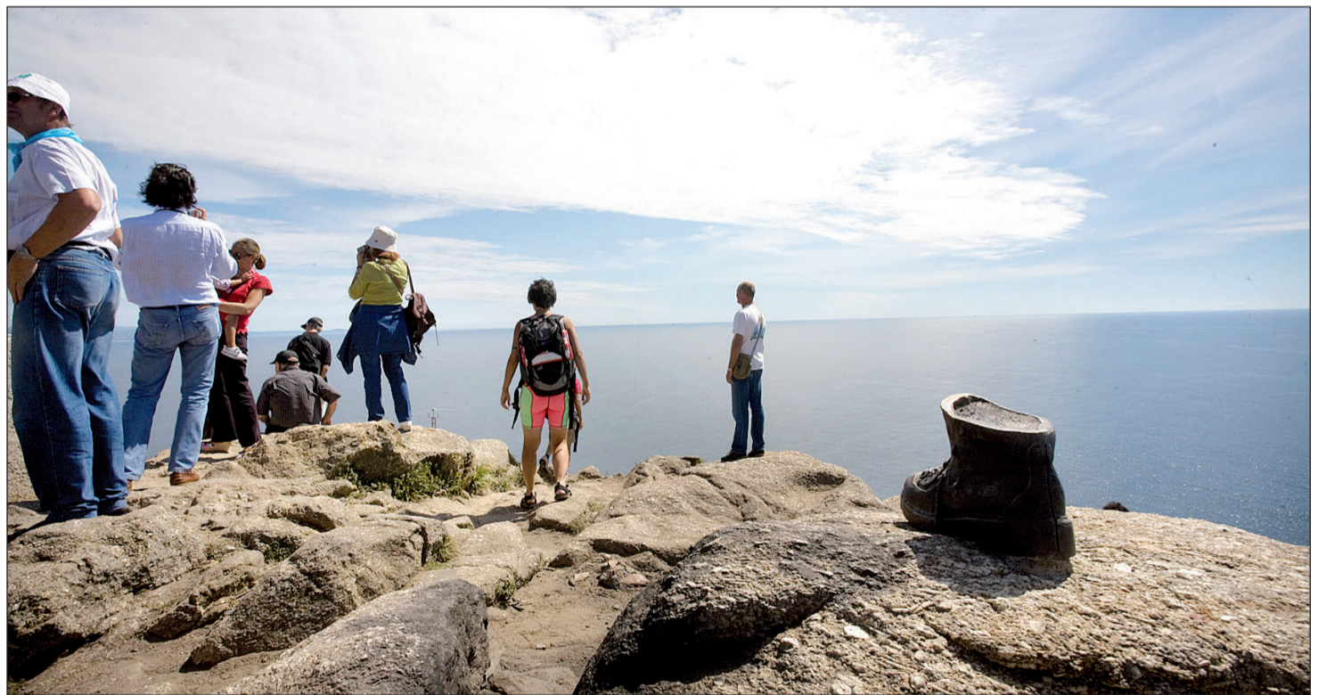
Un grupo de peregrinos contempla la hermosa vista que se puede apreciar desde Fisterra.