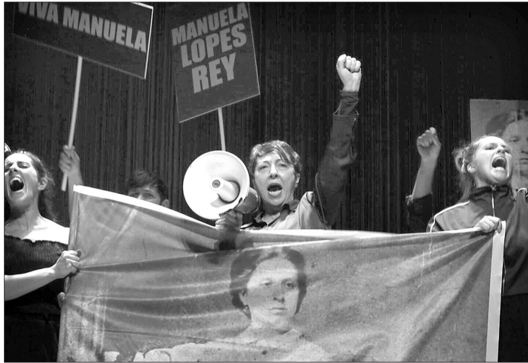
Una escena de la obra 'Manuela Rey Is In Da House', estrenada en Portugal.