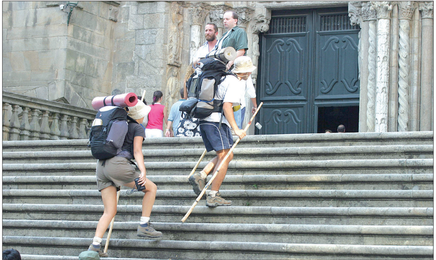
Un par de peregrinos, entrando en la Catedral de Santiago tras recorrer el Camino.

En concreto, en los últimos años, entre el 86% y el 90% de los gallegos valora de forma positiva o muy positiva la presencia de turistas en Galicia. Son porcentajes que apenas varían desde el año 2021 y que son mayores en aquellos segmentos vinculados directa o indirectamente con el turismo y muy positiva