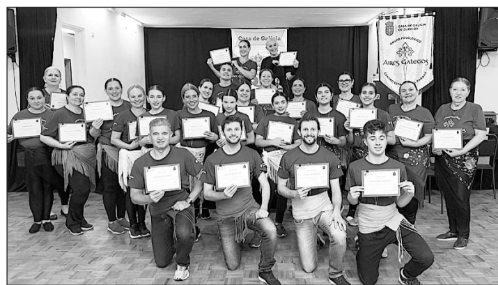
Los participantes en el taller posan con su diploma acreditativo.