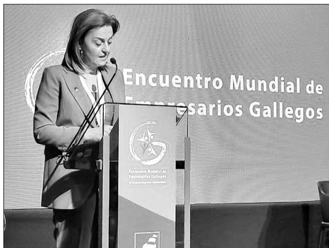
Rivo, durante su intervención en el Encuentro Mundial de empresarios.

“La galeguedade les une y les debe seguir juntando ante los retos que se nos presentan en esta economía global cambiante”, indicó Rivo, quien destacó la con-