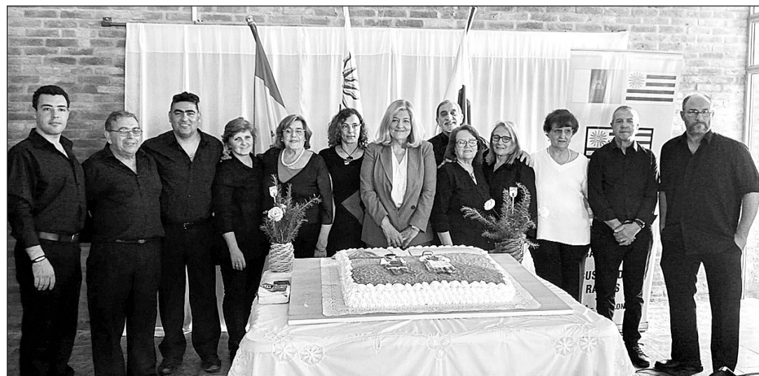
Miembros de la Asociación y la cónsul, junto a la tarta de aniversario.

Se volvió a homenajear a todos los canarios y sus descendientes que tanto han contribuido a la construcción y al desarrollo del departamento de Canelones y de todo