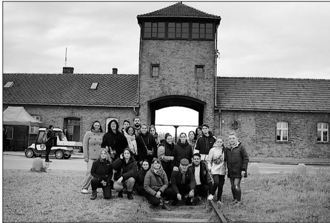
El grupo de excursionistas posan durante la visita al campo de exterminio Auschwitz II.

El segundo día los participantes visitaron, acompañados