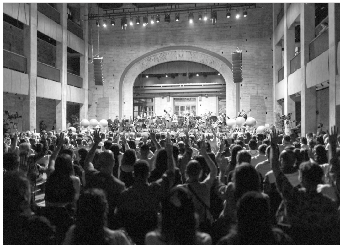
Una de las actuaciones gallegas en Colombia que fue seguida por numeroso público.