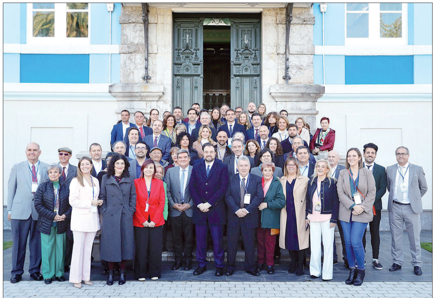
Autoridades y consejeros, el pasado día 6, delante del Archivo de Indianos, en Colombres (Asturias), donde se inauguró el pleno del CGCEE de este año.

La Comisión de Mujeres y Jóvenes pide asistencia jurídica para los casos de violencia de género