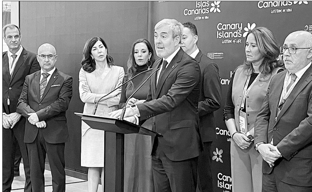
Fernando Clavijo, durante su intervención en la inauguración del stand de Canarias en la WTM de Londres.

“Aunque las previsiones tanto en conectividad aérea como en reservas de viajes son favorables para la temporada de invierno, la entrada en vigor el próximo 1 de enero del Régimen Europeo de Comercio de Emisiones aplicable a los vuelos entre Canarias y el resto del Espacio Económico Europeo, incluyendo a Reino Unido, podría tener efectos muy negativos para nuestra conectividad a corto y medio plazo y, por lo tanto, para el turismo de las islas”, explicó Clavijo.