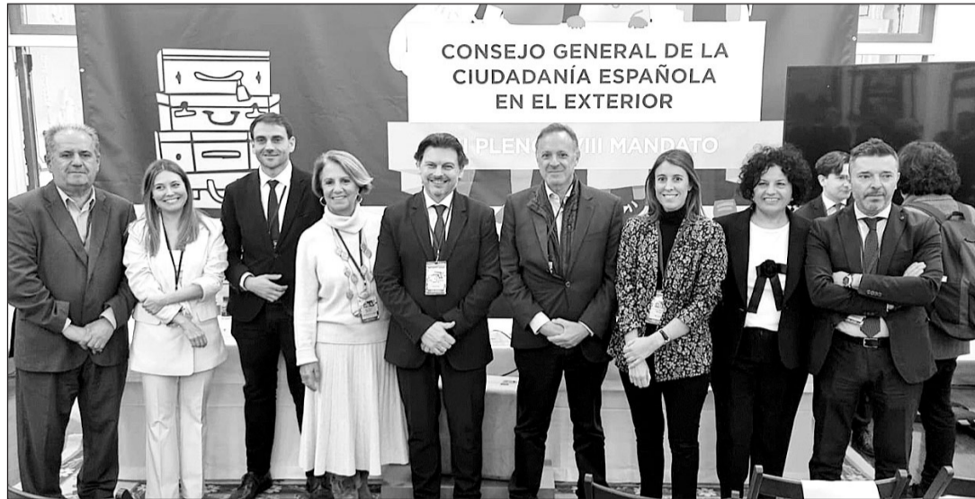
El secretario xeral —en el centro—, con representantes de emigración de otras comunidades autónomas en el CGCEE.

El secretario xeral hizo alusión a los casi 500.000 gallegos que están en el extranjero y para los que se puso en marcha la Estratexia Galicia Retorna como una medida para colaborar con los que se disponen a regresar al territorio, al tiempo que está destinada a paliar el déficit demográfico que presenta la comunidad autónoma. Al respecto, aseguró que la Estratexia facilitó la vuelta a Galicia a 28.000 personas en su primera edición (entre 2018 y 2022) y que la cifra