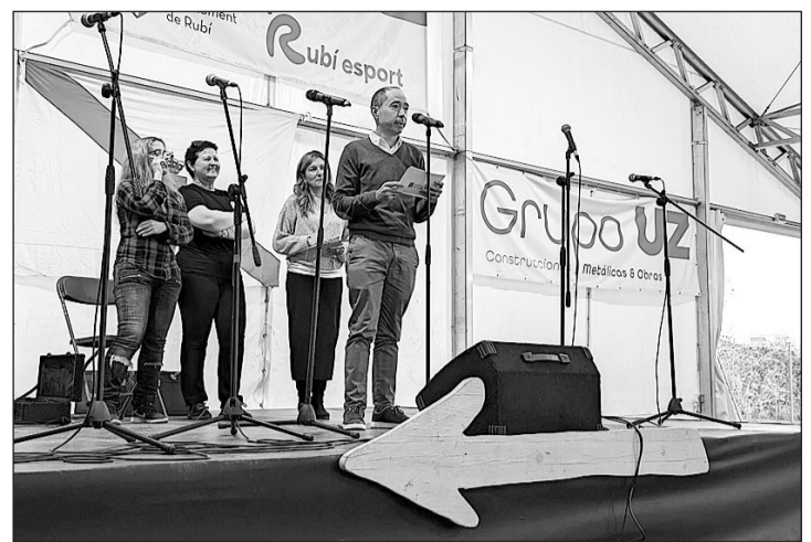
Emigración participó en la jornada de divulgación del Camino de Santiago.