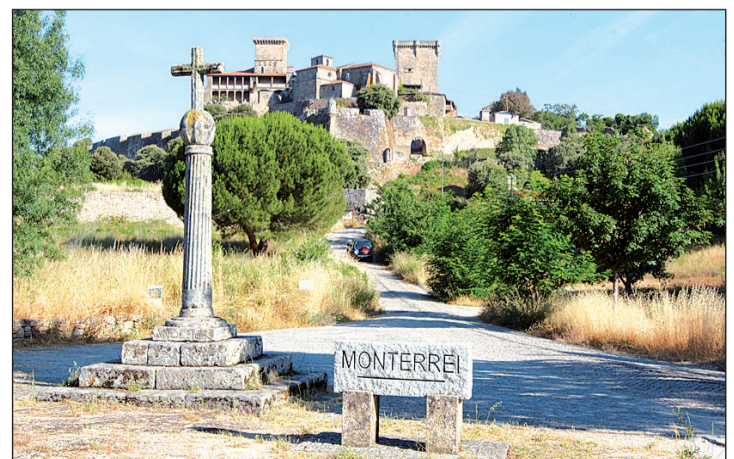
La fortaleza de Monterrei forma parte del patrimonio del Camino.

Esta encuesta dirigida a los residentes en la comunidad nació como un proyecto piloto en el año 2020 con el objetivo inicial de conocer la intención de viaje de los gallegos en contexto de pandemia al tiempo que buscaba medir su percepción y valoración respecto de la actividad turística y sus impactos. En los años sucesivos y con la recuperación paulatina del turismo, la encuesta se está focalizando en la percepción del turismo.