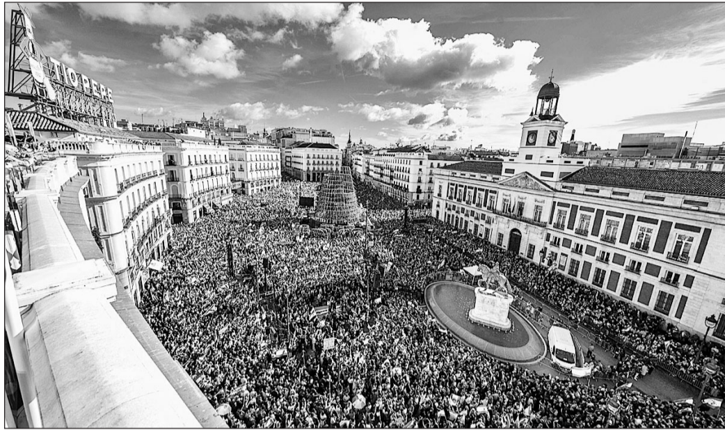
Panorámica de la manifestación del día 12 en la Puerta del Sol de Madrid.

dirigido al público la presidenta de la Comunidad de Madrid, Isabel Díaz Ayuso, quien alertó de que “Sánchez nos llevará a una dictadura si no hay contrapesos en el poder”. “Ha decidido ser el poder legislativo, ejecutivo y judicial”, criticó Ayuso, quien hizo un llamamiento a dar “la batalla” contra el “totalitarismo” de Sánchez, que ha decidido “regalar” España por sus acuerdos con las formaciones independentistas catalanas, a lo que Madrid se