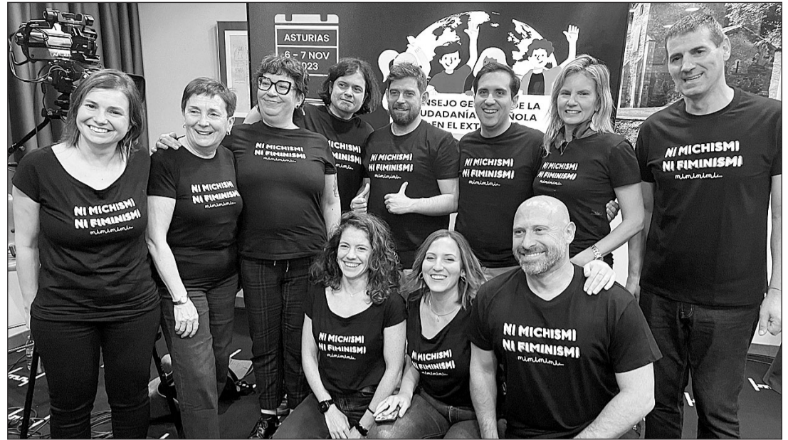
La presidenta de la Comisión de Jóvenes y Mujeres –agachada en el centro–, junto a otros miembros del Consejo.

En este punto, muchos de los consejeros recordaron la aplicación desigual que se hace tanto de la difusión del protocolo como de su aplicación y que varía de mane-