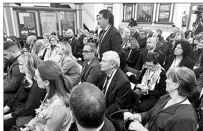
Miranda, durante su intervención en el acto inaugural, en Colombres.

El secretario xeral se lamentó de que “las comunidades autónomas somos las únicas que no tenemos un turno específico para explicar nuestras políticas” y recordó que las co-