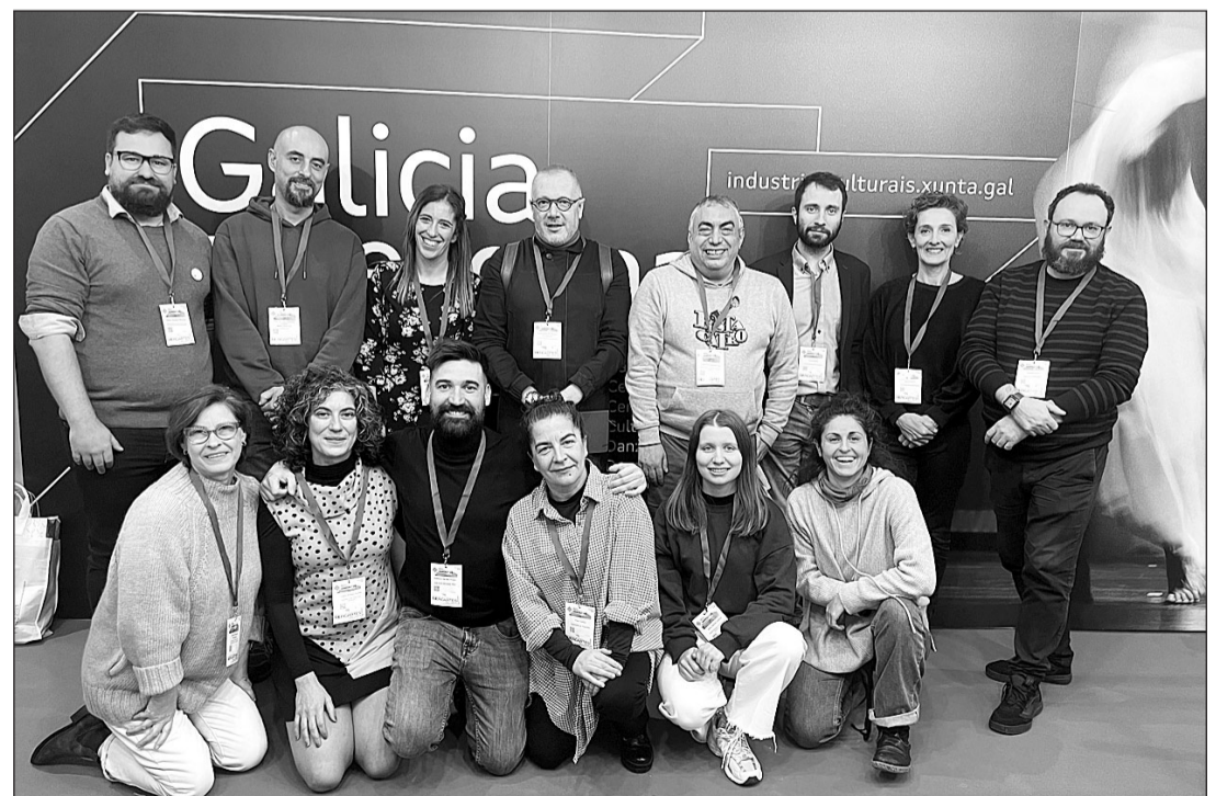
La delegación gallega que asistió a la feria Mercartes de Valladolid.

Xunta también difundió su catálogo digital 'Danza Galicia' con el fin de contribuir a una mayor visibilidad de los espectáculos coreográficos producidos en la Comunidad. Esta primera edición de la