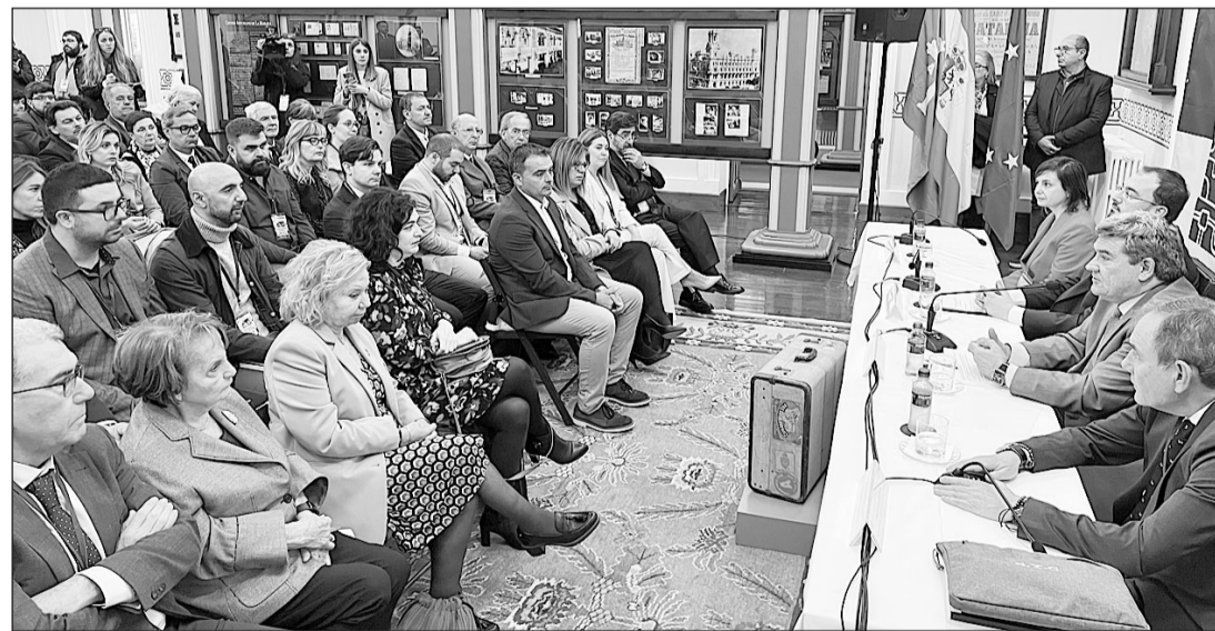
El ministro Escrivá –2º dcha.–, en el acto inaugural del pleno del Consejo, en el Archivo de Indios (Colombres). GM

Otro de los asuntos a los que hizo alusión el ministro al hablar del reglamento, que calificó de