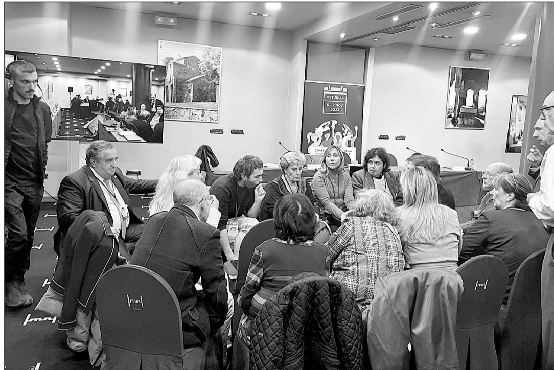
Los miembros de la Comisión de Derechos Civiles, durante el pleno celebrado en Oviedo.

La propuesta de reforma del Código Civil en materia de nacionalidad, que fue aprobada en el pleno con el respaldo de 41 miembros del Consejo (obtuvo dos votos negativos y 9 abstenciones), modifica y, en algunos casos, amplía, los apartados de los artículos 20, 23, 24 y 26 del Código Civil,