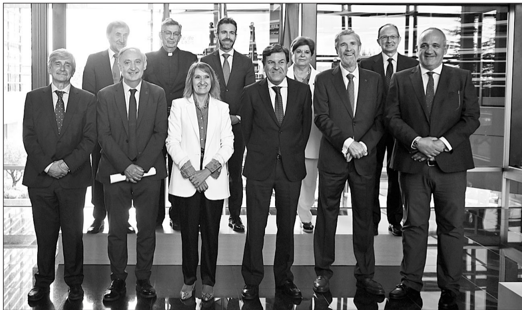
Los dos consejeros de la Junta posan junto a los nueve rectores de universidad.

ción se realizarán acciones coordinadas para: