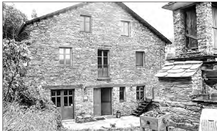
Casa Rural Norita, en la provincia de Lugo.

algunas de las actividades que se pueden realizar por la zona como senderismo, escalada, rutas en bicicleta, o en barco, kayak, surf, alquiler de quads o tiro con arco, entre otras.