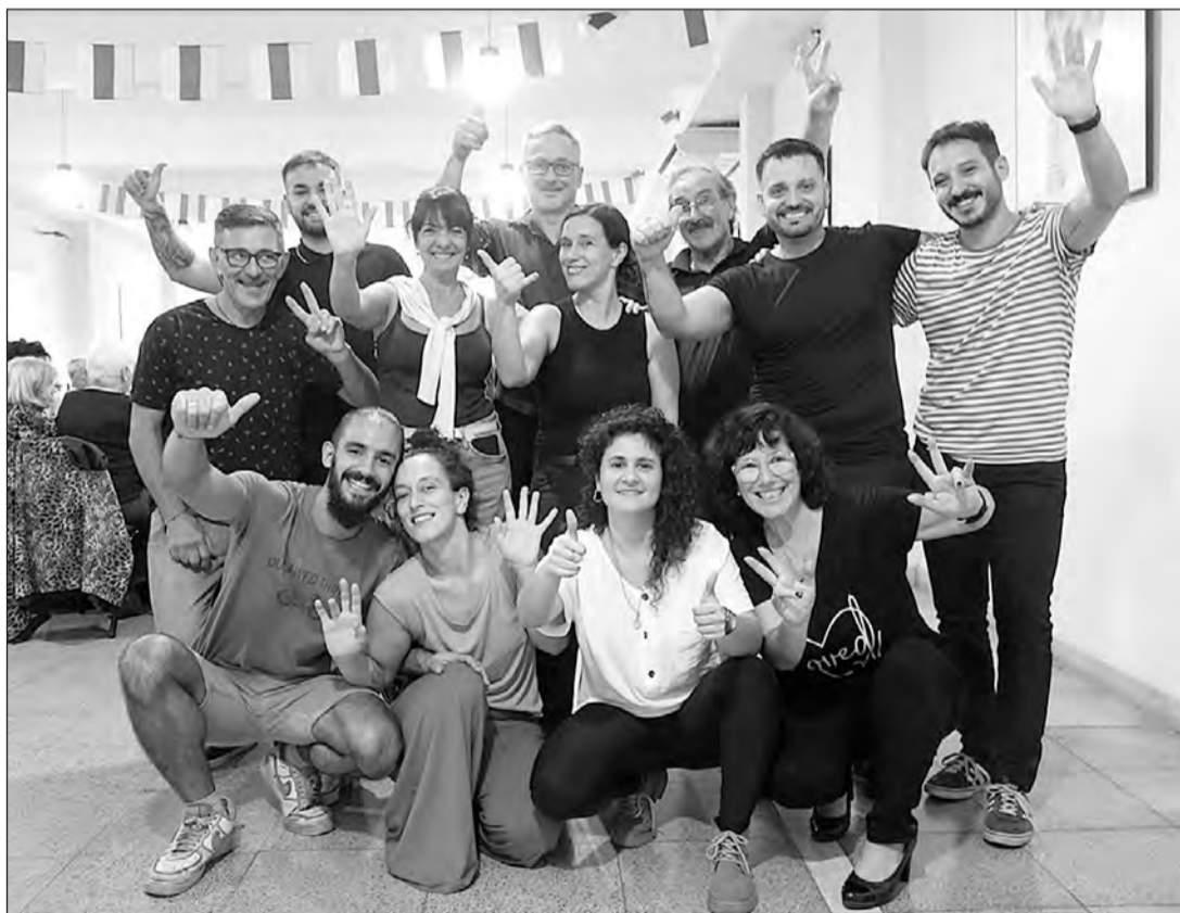
Integrantes de la Comisión Directiva de la entidad.