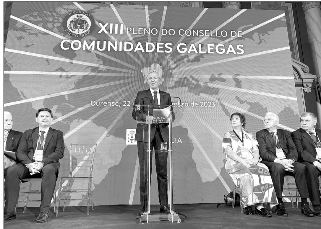
Alfonso Rueda, durante su intervención en el Pleno del Consello de Comunidades Galegas.

Agradeció ante los representantes de las entidades todo lo que la colectividad “hace por Galicia desde el exterior”