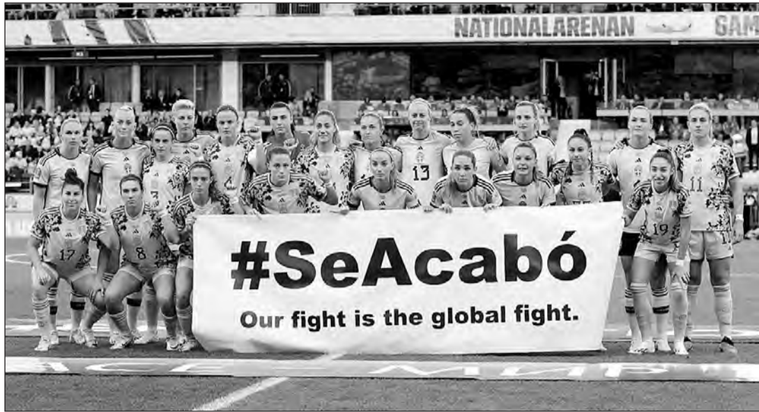
Los jugadoras españolas y suecas posaron con una pancarta antes del partido que les enfrentó.

El magistrado ya ha recibido a través de la Embajada de Australia el certificado del contenido de todos los delitos del Código Penal de aquel país en relación con los hechos investigados y que son aplicables en el Estado de Nueva Gales del Sur.