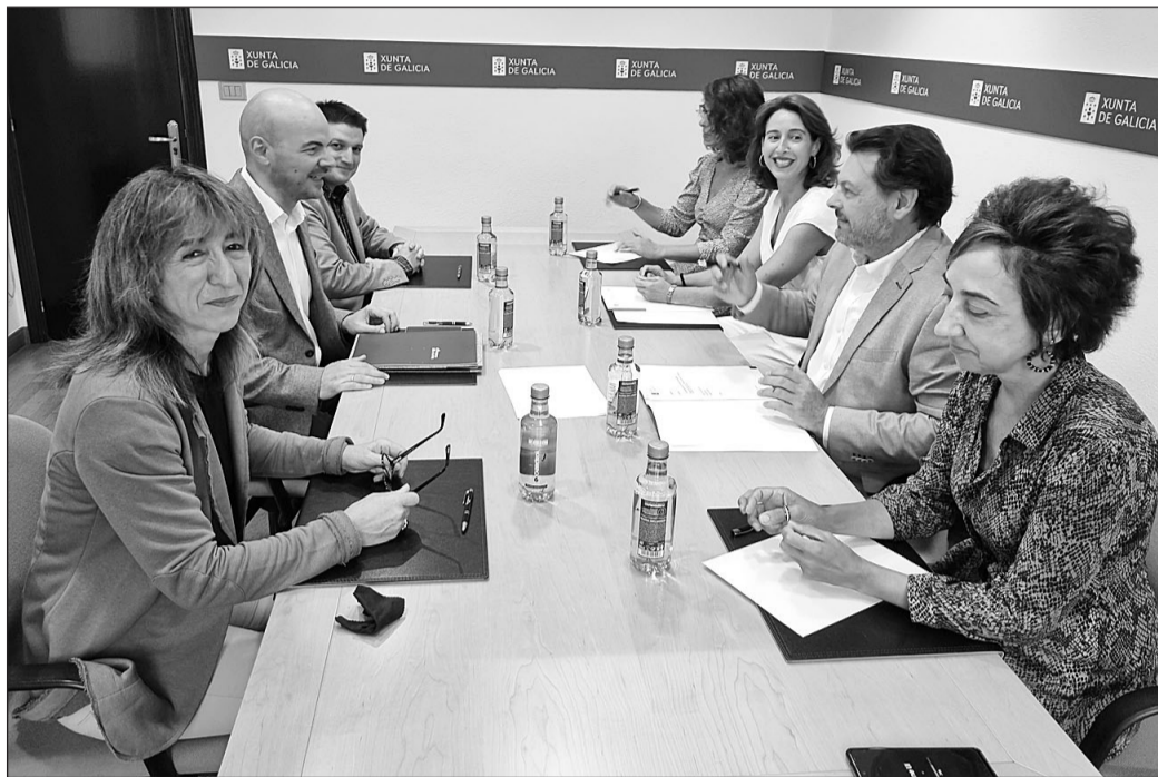
Los equipos técnicos de ambos departamentos autonómicos, durante la reunión.

El secretario xeral destacó que la continuidad de este programa –la primera edición fue la primera estrategia integral de apoyo al retorno puesta en marcha en España– busca por