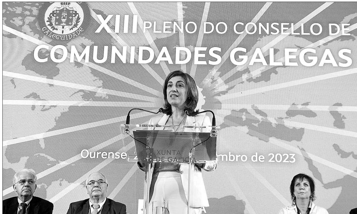
La vicepresidenta Ángeles Vázquez, durante el acto de clausura del Consello de Comunidades Galegas.

“Somos conscientes de que sin la juventud, sin las ideas frescas, sin los retos imposibles, Galicia no sería lo que es. Galicia está con vosotros desde siempre, nace con vo-