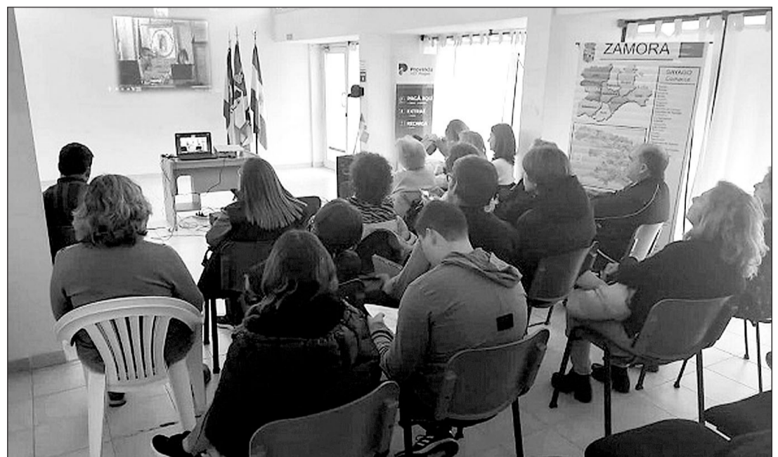
Asistentes a la charla virtual en el Centro Regional Castellano y Leonés de Tres Lomas.

Durante la charla, además de personas radicadas en esa ciudad, habían llegado interesados desde Salliqueló y Quenumá.