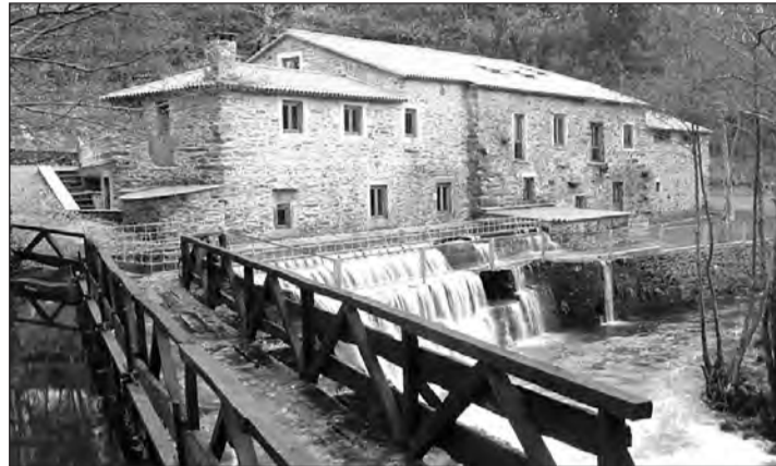
O Muiño de Pena, en O Pino, provincia de A Coruña.

También en Muxía se encuentra Casa Castiñeira , una casa de aldea centenaria donde disfrutar de platos como unas espectaculares vieiras, cazuela de pescado o un solomillo de cerdo con champiñones, entre otras propuestas. La experiencia se puede completar con