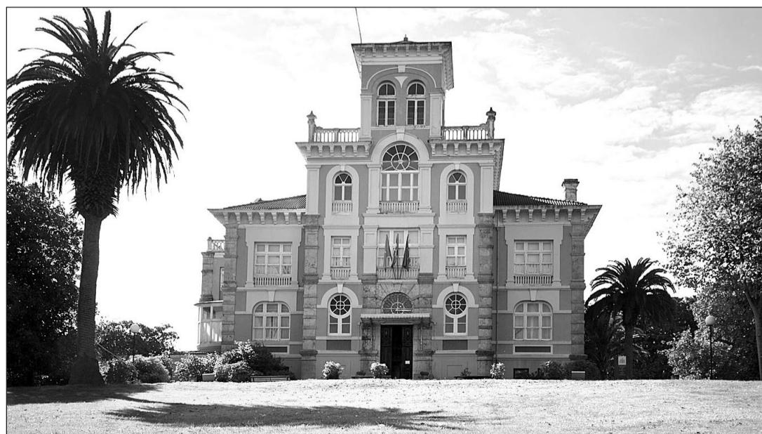
La sede de la Fundación Archivo de Indianos-Museo de la Emigración de Asturias acogerá el Pleno del CGCEE.

jo, tanto los consejeros electos como los designados por la Ad-