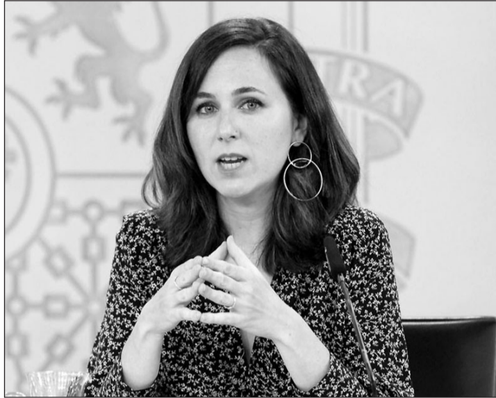
Ione Belarra, ministra de Derechos Sociales y Agenda 2030.

El CRE apunta en su escrito que entonces la ministra argumentaba, para incluir a este colectivo en los viajes, lo siguiente: “La lectura debe hacerse de forma subordinada al mandato legal de los artículos 18 y 20 de la Ley del Estatuto de ciudadanía española en el exterior”. Esta ley establece que “el Estado extenderá para los españoles en el exterior y sus familiares, la acción protectora de la Seguridad Social y que