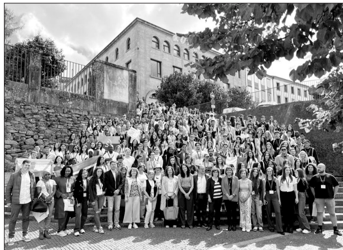
Autoridades de la Xunta y de la USC recibieron a los nuevos alumnos.

El acto, al que asistió Begoña Solís, tuvo lugar en el emblemático Pazo de Fonseca de la capital compostelana