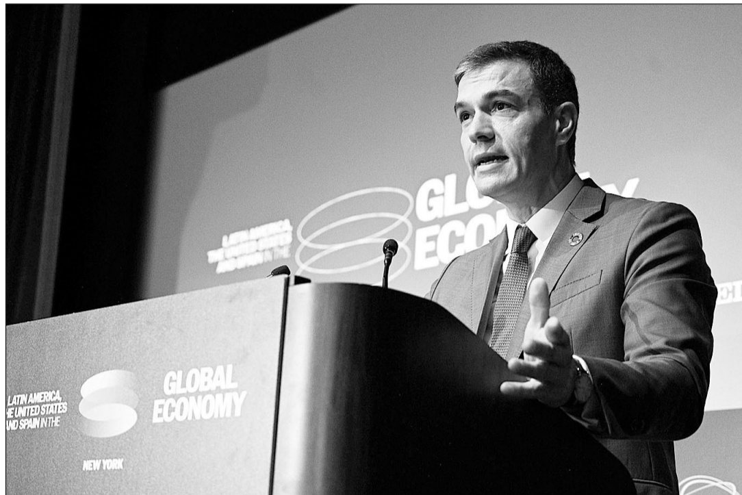
El presidente del Gobierno en funciones, Pedro Sánchez, durante su intervención en el Foro Económico Empresarial organizado por la Cámara de Comercio hispana en Nueva York.

artículo 155 de la Constitución en aquel año 2017 fue “fundamental” para que los independentistas supieran que el Estado tiene mecanismos para defenderse. Al tiempo, y ante la posibilidad de que Sánchez se avena a aceptar las exigencias de Puigdemont, el expresidente calificó de “fraude” contra la Constitución una posible amnistía del proceso y una “enmienda a la totalidad” de la democracia española.