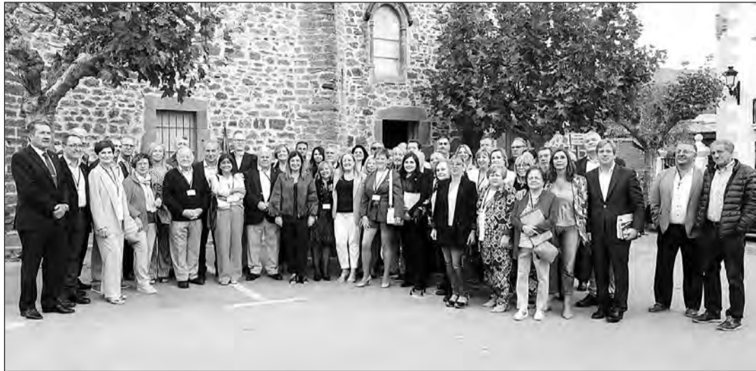
La presidenta de Cantabria, acompañada de otros consejeros, posa junto a los asistentes a este IX Encuentro. GM