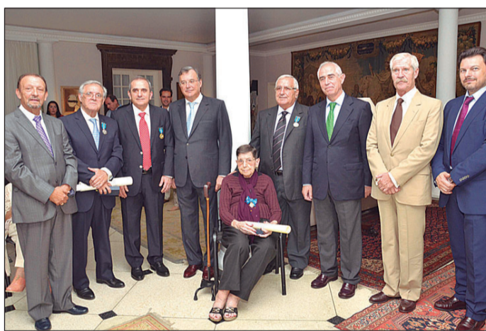
Miras, Miranda y dirigentes diplomáticos, junto a los cuatro galardonados.